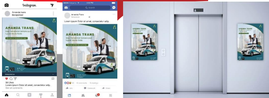
Gambar 5. Attention