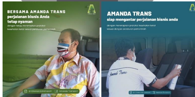
Gambar 6. Interest