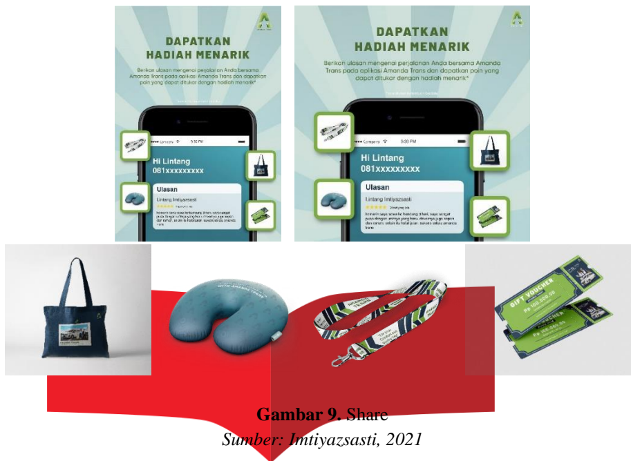
Gambar 9. Share