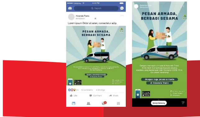
Gambar 7. Search

Selanjutnya pada bagian search, penulis merancang kegiatan amal di mana uang yang didapatkan berasal dari biaya sewa kendaraan konsumen. Poster kegiatan ini akan dibagikan melalui story ads pada instagram dan juga melalui facebook ads.