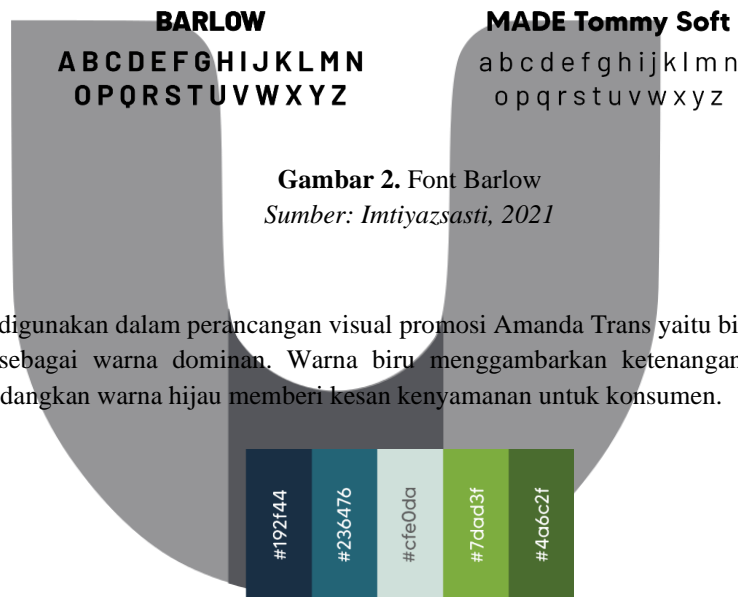
Gambar 2. Font Barlow