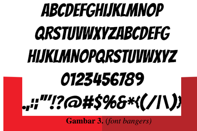
Gambar 3. (font bangers)

Sedangkan efek tulisan pada komik biasanya diletakkan pada dalam gambar pada panel dengan tujuan membantu menerjemahkan adegan pada komik. Karakter font yang digunakan berupa jenis yang tebal dan besar dengan maksud memberikan kesan lebih dramatis dan dapat terlihat di dalam panel. Jenis font yang digunakan jenis sans serif “Bangers”.