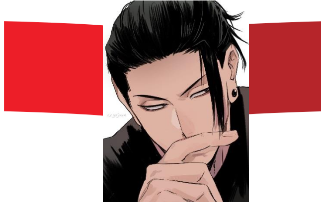
Gambar 1. (contoh visual gambar penggambaran semi realis dan pewarnaan cell shading )

Konsep pada warna yang diberikan komik berwarna pada karakter yang diberikan, teknik pewarnaan cell shading juga digunakan untuk memberikan volume pada gambar lebih efisien dan jelas, dan pemberian warna hitam sebagai penegas pada gambar.