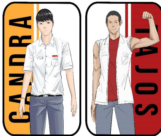
Gambar 10. (desain gantungan kunci)