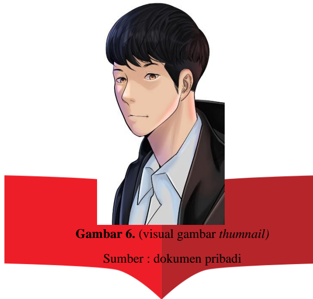
Gambar 6. (visual gambar thumbnail )