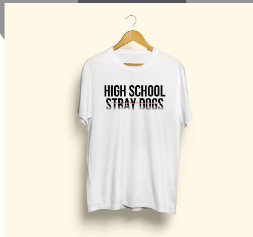
Gambar 8. (desain kaos putih)