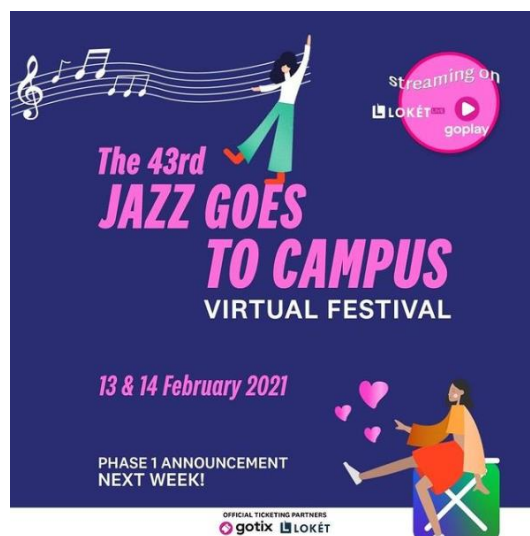
Gambar 1.3 Gambar Jazz Goes To Campus Virtual Festival (Gambar berasal dari instagram.com/jgtcfestival , diakses pada 16/12/2020 – 13.51)

Acara ini peneliti pilih sebagai objek penelitian karena menjadi salah satu acara yang ramai dikunjungi dan ditunggu oleh para penikmat musik. Hal ini didukung dari laman berita femina.co.id yang ditulis oleh Mendrofa (2020), dimana Jazz Goes To Campus Festival selalu menjadi acara yang sangat ditunggu di setiap tahunnya bagi para penikmat musik dengan jumlah pengunjung di setiap tahunnya hingga 20.000 orang. Bahkan, Jazz Goes To Campus juga berharap dapat berkontribusi kepada tumbuh kembang musik jazz di Tanah Air. Hal-hal tersebut membuat Jazz Goes to Campus tetap mengadakan acara secara virtual di masa Pandemi Covid-19.