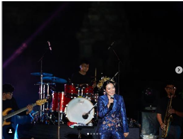
Gambar 1.2 Prambanan Jazz Festival 2020

Akan tetapi, konser virtual memiliki tantangan tersendiri bagi para pekerja di bidang industri musik. Mengutip dari republika.co.id yang ditulis oleh Rostanti (2020), menurut Anas Syahrul Alimi selaku founder dari Rajawali Indonesia, saat Ia sukses mengadakan acara konser virtual , terdapat kendala berupa kondisi cuaca yang berubah serta adanya kendala koneksi internet pada saat jalannya acara Prambanan Jazz Festival. Menurutnya, diperlukan adaptasi bagi para promotor musik, khususnya Rajawali Indonesia dalam menjalankan acara Prambanan Jazz Festival. Dewi Gontha juga memberikan pendapat mengenai konser yang diadakan secara virtual . Menurutnya, dalam hal produksi memang tidak ada masalah, akan tetapi, yang menjadi kendala adalah terletak pada koneksi internet pada tiap masing-masing penonton. Sehingga, ini mempengaruhi kepada kualitas konser secara virtual . Ia pun tidak menampik, menonton secara langsung tentu berbeda dengan menonton secara virtual dari pengalaman yang didapat oleh penonton. Akan tetapi, konser virtual menurutnya adalah salah satu upaya bagi pekerja industri kreatif untuk bisa bertahan di masa pandemi Covid-19 ini.