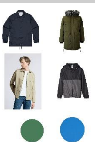
Gambar 2 Referensi Warna

Warna merupakan salah satu unsur keindahan dalam seni dan desain selain unsur visual yang lainnya. Menurut Monica & Luzar (2011) mendefinisikan bahwa warna dibagi menjadi 2 yaitu warna fisik dan psikologis. Warna fisik merupakan sifat cahaya yang dipancarkan, sedangkan psikologis merupakan bagian dari pengalaman penglihatan. Warna dapat mengkomunikasikan desain secara efektif karena memberikan dampak terhadap psikologi, suasana hati dan sugesti. Secara umum warna dapat memberikan kesan dalam memperlihatkan sebuah karakter. Warna yang digunakan dalam perancangan ini yaitu warna dominasi kontras yang memiliki daya tarik pada ketajaman penglihatan. Pemilihan warna hijau dongker dan biru laut dikarenakan memiliki kekontrasan dalam warna semi gelap untuk menegaskan tekstur material.