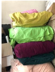
Gambar 1 Material

Pemilihan material harus sesuai dengan permasalahan yang dialami oleh perancang setiap studi kasus yang sedang dihadapi (Wibowo, 2009). Dalam perancangan jaket ini aspek material menggunakan kain kanvas untuk menggantikan kain parasut yang sudah terkenal beredar pada kalangan bahan utama jaket windbreaker umumnya