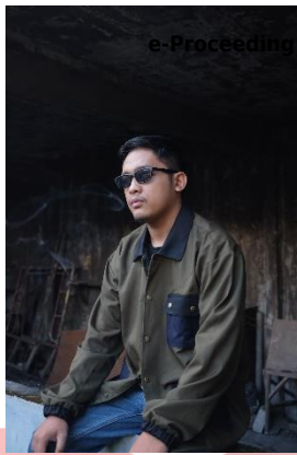
Gambar 8 Penggunaan terhadap user atau model