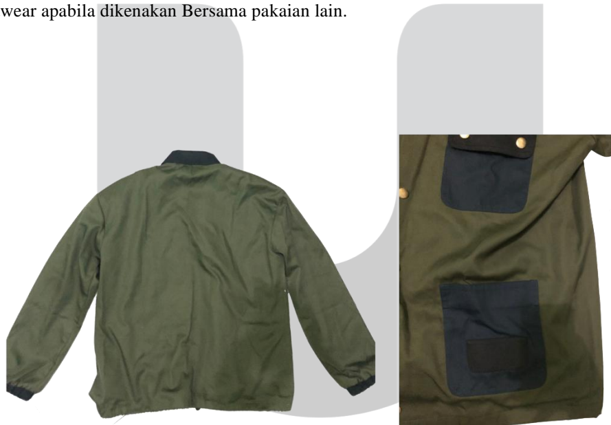
Gambar 7 Detail Produk

Pada gambar diatas merupakan final produk perancangan jaket windbreaker dengan bahan canvas ini, menargetkan pada pengguna iklim tropis. Perancangan ini dibuat se sederhana mungkin untuk mendukung sebagai outwear apabila dikenakan Bersama pakaian lain.