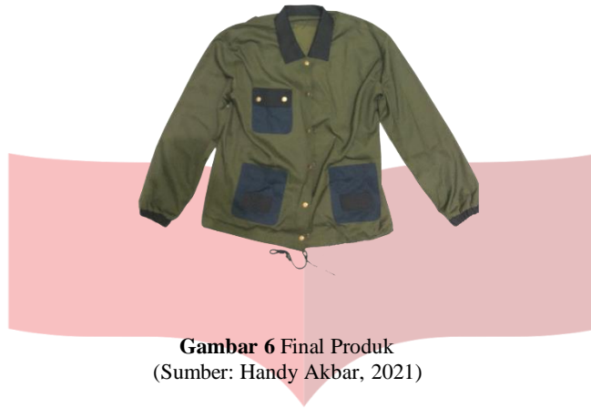
Gambar 6 Final Produk

Pada gambar diatas merupakan final produk perancangan jaket windbreaker dengan bahan canvas ini, menargetkan pada pengguna iklim tropis. Perancangan ini dibuat se sederhana mungkin untuk mendukung sebagai outwear apabila dikenakan Bersama pakaian lain.