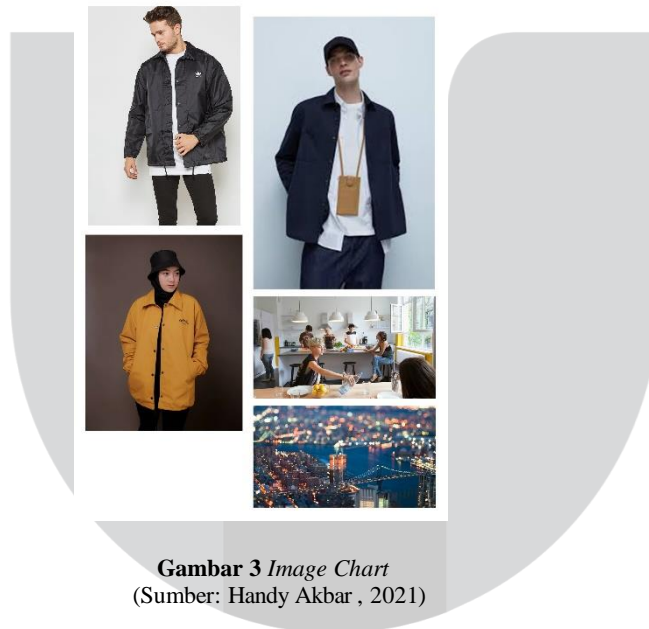
Gambar 3 Image Chart

Pembahasan selanjutnya yaitu konsep perancangan mengenai bentuk dan warna jaket. Dimana jaket ini memiliki warna netral seperti hijau dongker dan biru laut. Pemilihan warna ini sesuai dengan warna pendukung untuk bahan material utama