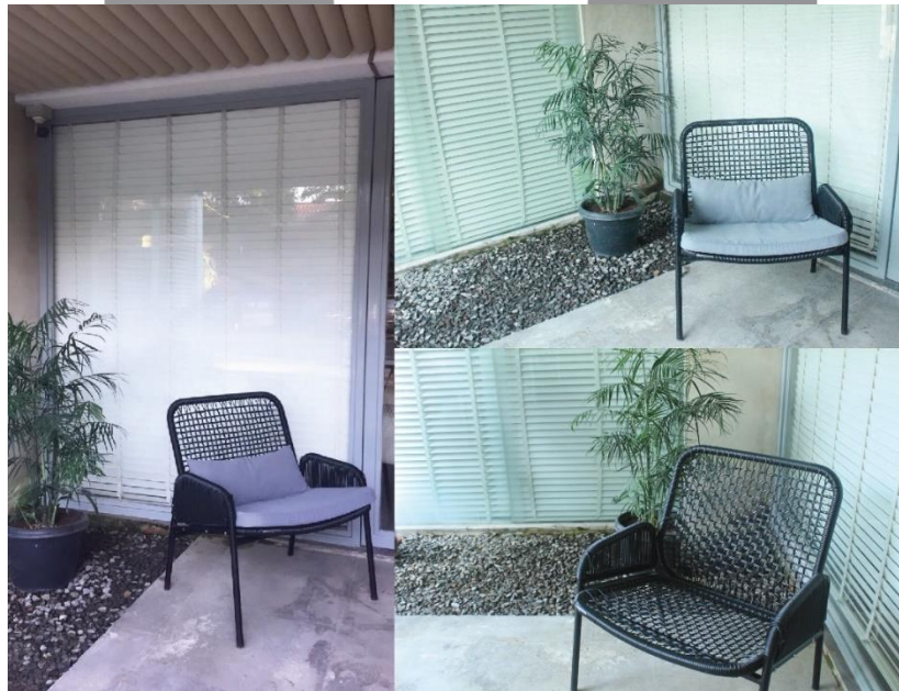
Gambar 1. Foto Studi Produk Real 1:1 Disesuaikan Penempatan