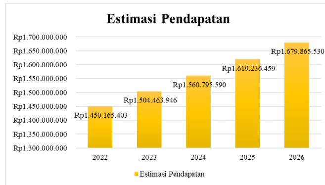
Gambar 3. Estimasi Pendapatan Cabang Toko Strawberry