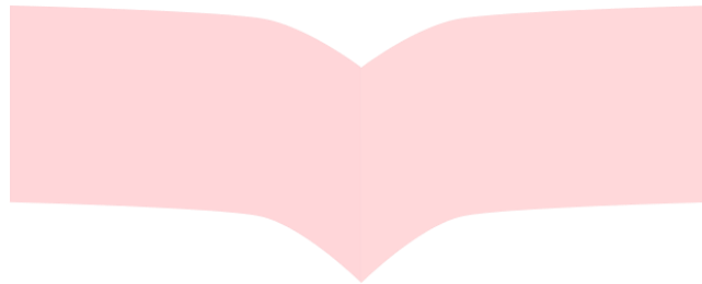
Gambar 2. 1 Kerangka Pemikiran

Dari seluruh definisi yang sudah diuraikan dapat ditarik kesimpulan bahwa keputusan pembelian merupakan pertimbangan-pertimbangan yang dilakukan oleh konsumen dalam menyeleksi suatu produk sebelum melakukan pembelian.