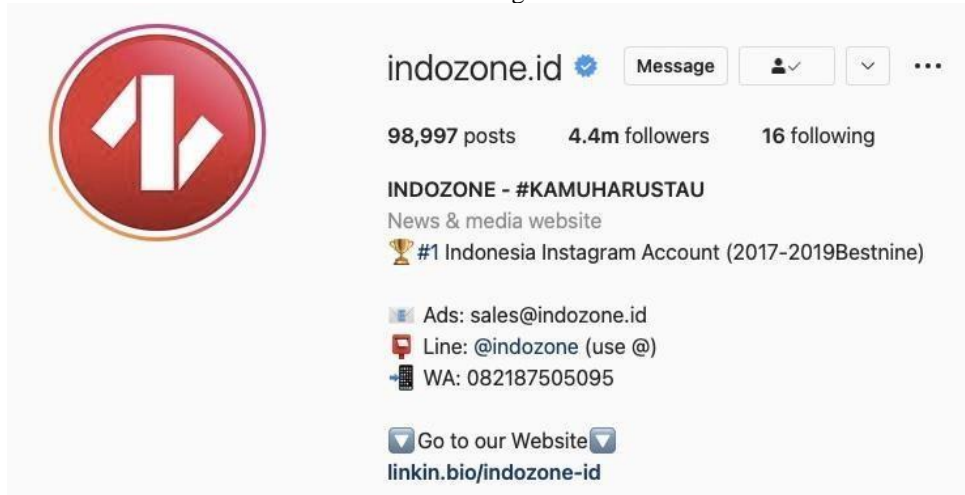
Gambar 3 Akun Instagram @indozone.id