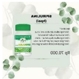
GAMBAR 4.3 Konten Promosi Produk

Konten marketing yang dibuat penulis seperti di atas berupa promosi produk, dimana didalam postingan tersebut terdapat penjelasan manfaat dari setiap produk, harga, dan logo Herbal Hayati.