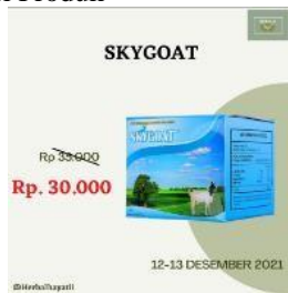
GAMBAR 4.2 Konten Informasi Produk

Produk sky goat mendapatkan potongan harga Rp 5.000 dan produk gamat mendapatkan potongan harga Rp 20.000.