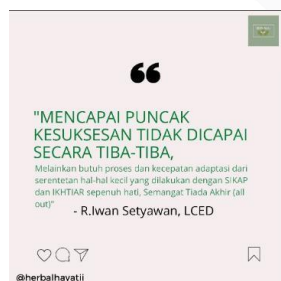
GAMBAR 4.4 Konten Quotes

Konten Marketing yang dibuat oleh penulis yaitu kutipan tentang motivasi "Mencapai puncak kesuksesan tidak dicapai secara tiba – tiba.