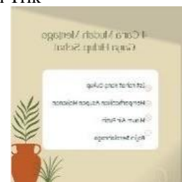
GAMBAR 4.1 Konten Tips Dan Trik