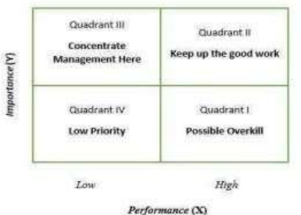
Gambar 1. IPA

Menurut Martin, Mendoza, & Romain, 2019 dalam Darwas et al, (2020) Importance Performance Analysis (IPA) telah menjadi standar yang memberikan wawasan kepada manajemen untuk menentukan kekuatan dan kelemahan. Importance Performance Matrix sangat bermanfaat sebagai pedoman dalam mengalokasikan sumber daya organisasi yang terbatas pada bidang – bidang spesifik, dimana perbaikan kinerjanya bisa memiliki dampak yang besar. Selain itu, matriks ini juga menunjukkan bidang atau atribut tertentu yang perlu dipertahankan dan aspek – aspek yang perlu dikurangiprioritasnya.