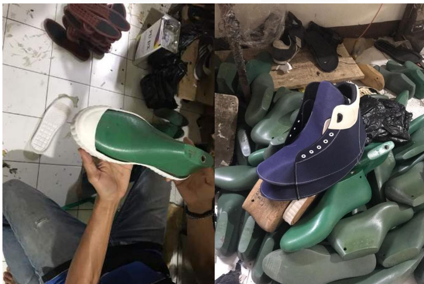
Gambar 1 3D Modelling