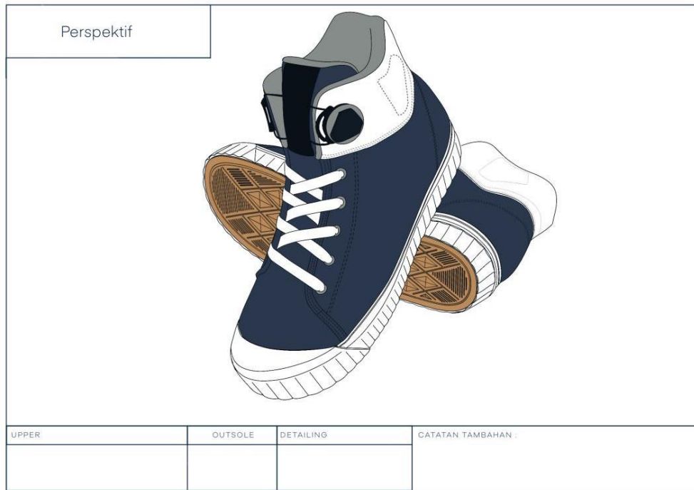
Gambar 2 Sketsa Final