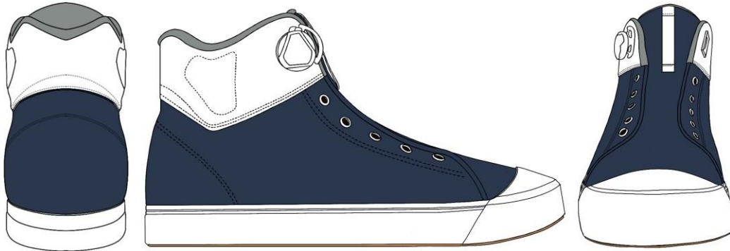
Gambar 1 Sketsa Final