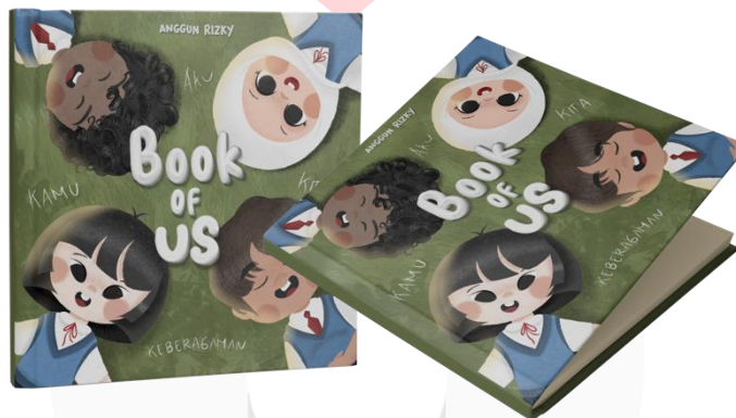
Gambar 4.1 Media Utama Buku Ilustrasi

Dirancangnya buku ilustrasi berjudul “ Book of Us: Aku, Kamu, Kita, dan Keberagaman ”. Buku ini berisi mengenai keberagaman yang terjadi di lingkungan sekitar khususnya di sekolah. Di kemas dengan ukuran 20x20cm, hardcover , berjumlah 30 halaman.