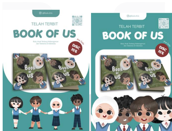
Gambar 4.3 Media Pendukung Poster

Poster dianggap sebagai media yang membantu menarik perhatian target sekaligus memberi informasi produk.