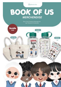
Gambar 4.5 Media Pendukung Merchandise

Merchandise berupa totebag, botol minum, maupun sticker sebagai media pendukung dipergunakan untuk meningkatkan penjualan. Pembuatan media pendukung berikut pun disesuaikan dengan kegunaan untuk targetnya.