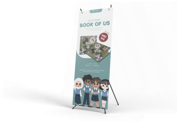
Gambar 4.4 Media Pendukung Poster

X-banner pun dianggap sebagai media promosi dan informasi mengenai produk.