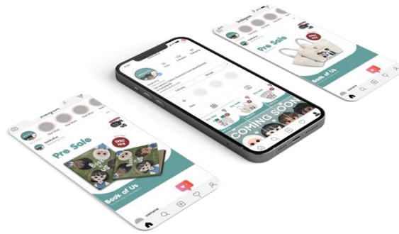
Gambar 4.2 Media Pendukung Instagram

Media pendukung Instagram dipergunakan sebagai media dimana aktivitas pengenalan produk maupun promosi dilakukan di dalamnya dengan tujuan menarik perhatian target.