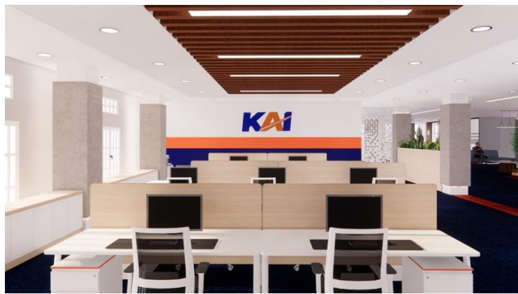
Gambar 3. Pengaplikasian Bentuk Dalam Perancangan

Bentuk geometris ini muncul untuk memperkuat kesan ruang dan menciptakan suatu keteraturan di dalamnya. Bentuk geometris yang mendominasi adalah segi empat dengan tambahan bentuk geometris lainnya seperti lingkaran, persegi panjang dan lain sebagainya. Konsep bentuk ini juga terinspirasi dari bentuk dan logo perusahaan PT. KAI dan diaplikasikan pula ke dalam bentuk furnitur sebagai berikut: