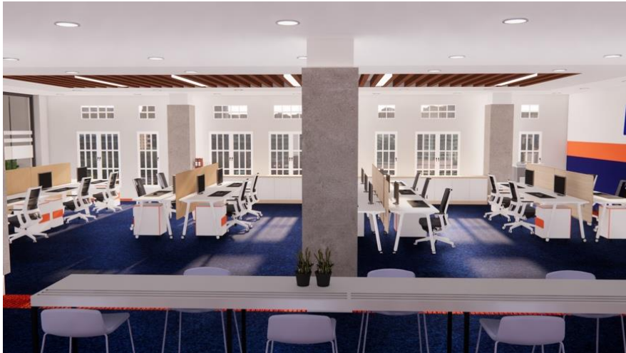
Gambar 8. Pengaplikasian Pencahayaan Alami Pada Ruangan

Pencahayaan buatan dalam kantor dibagi ke dalam pencahayaan umum dan khusus, yang keduanya digunakan sesuai dengan keperluan masing-masing. Pencahayaan umum mempergunakan downlight lamp yang menerangi setiap bagian ruangan sesuai dengan kebutuhan. Pencahayaan buatan lainnya menggunakan LED strip serta lampu gantung yang akan ditempatkan pada beberapa ruang seperti mini lounge karyawan dll. Accent light juga digunakan sebagai tambahan pencahayaan buatan dalam hal estetika dalam mewujudkan suasana ruang yang natural dan hangat.