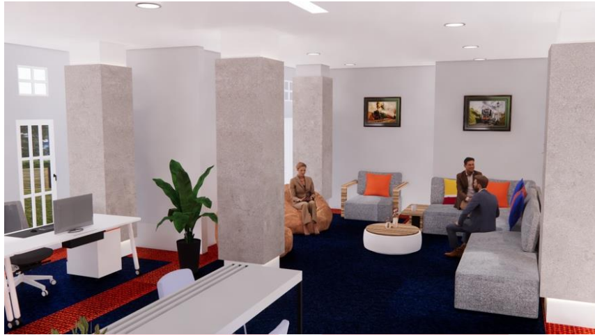
Gambar 4. Area Santai Karyawan