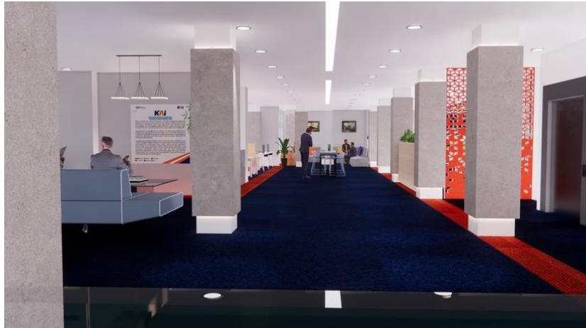
Gambar 9. Pengaplikasian Pencahayaan Buatan Pada Ruang

Sistem keamanan dalam perancangan digunakan untuk memproteksi keamanan, kecelakaan, dan kebakaran yang terjadi dalam gedung. Penggunaan CCTV untuk memantau kegiatan yang terjadi dalam gedung dan memberikan perlindungan dari ancaman pencurian, untuk sistem keamanan dari kebakaran menggunakan sarana seperti APAR, sprinkler, smoke detector, dan fire alarm system.