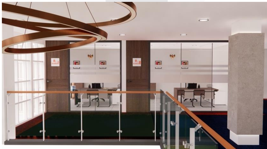
Gambar 6. Pengaplikasian Konsep Material Dinding Pada Perancangan

Keseluruhan material yang dipergunakan pada dinding di kantor unit SPI didominasi oleh penggunaan dinding bata dengan finishing cat tembok. Cat tembok dipilih karena memiliki banyak varian warna dan mudah dalam perawatannya. Selain itu, terdapat material kaca yang dipergunakan pada ruang kepala bidang pengawas SPI, dan ruang meeting. Pengaplikasian kaca ini merupakan salah satu implementasi dari nilai tata perusahaan yaitu transparan. Material pada ceiling di kantor SPI ini didominasi oleh material gypsum dengan bentuk ceiling yang datar. Pada area kerja, penggunaan wall slat di ceiling bertujuan untuk membuat kesan ruang yang modern dan hangat.