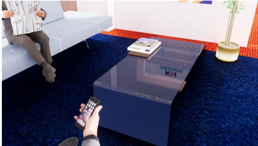
Gambar 5. Pengaplikasian Konsep Material Pada Perancangan

Keseluruhan material yang dipergunakan pada dinding di kantor unit SPI didominasi oleh penggunaan dinding bata dengan finishing cat tembok. Cat tembok dipilih karena memiliki banyak varian warna dan mudah dalam perawatannya. Selain itu, terdapat material kaca yang dipergunakan pada ruang kepala bidang pengawas SPI, dan ruang meeting. Pengaplikasian kaca ini merupakan salah satu implementasi dari nilai tata perusahaan yaitu transparan. Material pada ceiling di kantor SPI ini didominasi oleh material gypsum dengan bentuk ceiling yang datar. Pada area kerja, penggunaan wall slat di ceiling bertujuan untuk membuat kesan ruang yang modern dan hangat.