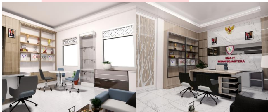
Gambar 7 Redesign Ruang Kepala Sekolah SMPIT

Ruang kepala sekolah adalah salah satu ruangan yang penting dalam perancangan sekolah karena kepala sekolah kerap menerima tamu khusus yang tidak melalui pelayanan informasi secara umum. Ruang kepala sekolah eksisting pada saat ini masih tergabung dan berbagi tempat antara SMPIT dan SMAIT. Pembangunan ruang kepala sekolah SMAIT sedang dilaksanakan sehingga tidak ada foto eksisting yang tersedia untuk saat ini. Gambar 7 dan 8 berikut ini merupakan hasil perancangan ulang ruang kepala sekolah SMPIT dan rancangan baru ruang kepala sekolah SMAIT.