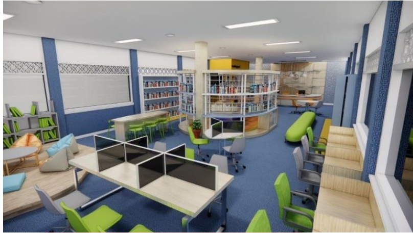
Gambar 13 Redesain Perpustakaan

perpustakaan. Gambar 13 berikut ini adalah hasil perancangan ulang ruang perpustakaan.