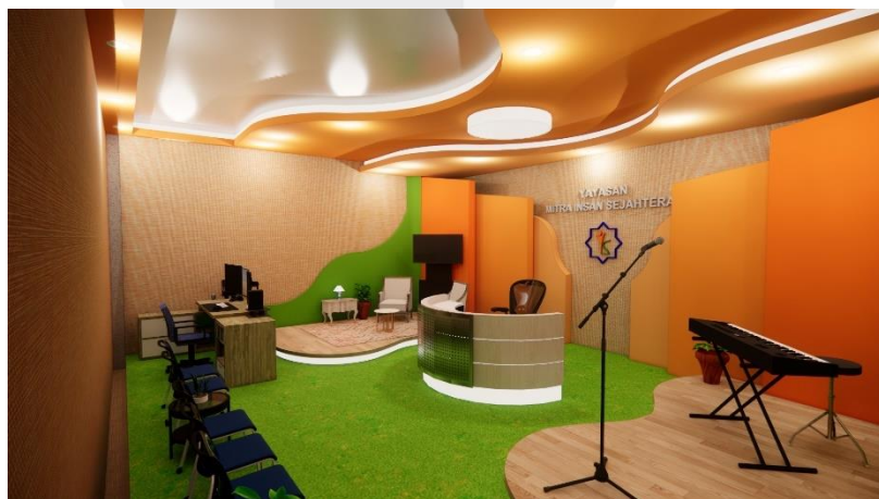
Gambar 14 Rancangan Ulang Ruang Studio Eksisting

Ruang studio di sekolah merupakan tempat untuk membuat karya digital baik guru maupun siswa. Contoh untuk guru adalah pembuatan materi pembelajaran, pembuatan video informasi, dll. Dan untuk siswa adalah untuk rekaman music ekstrakurikuler, pembuatan video podcast, dll. Gambar 14 berikut ini adalah hasil perancangan ulang ruang studio.