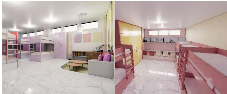
Gambar 11 Redesign Kamar Tidur Asrama Putri Tipe A