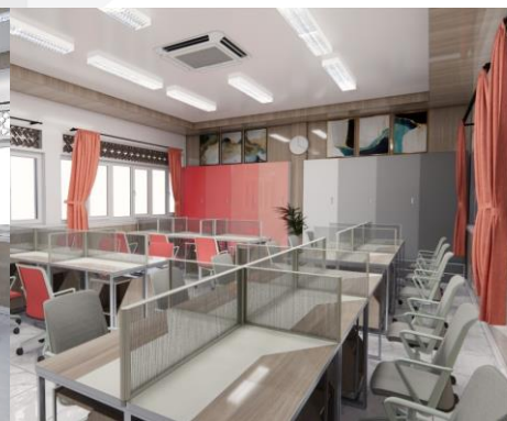
Gambar 6 Rancangan Ruang Guru SMAIT