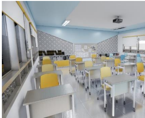
Gambar 3 Redesign Ruang Kelas SMPIT Sumber : Dokumentasi penulis