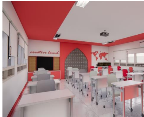
Gambar 4 Redesign Ruang Kelas SMAIT