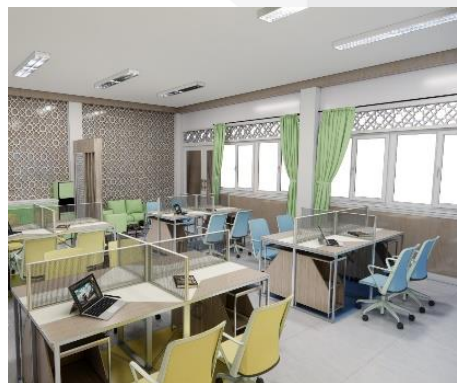
Gambar 5 Redesign Ruang Guru SMPIT

Ruang guru di sebuah sekolah berfungsi untuk tempat beristirahat guru ketika telah menyelesaikan proses mengajar didalam kelas. Ruang guru juga bisa digunakan oleh guru - guru untuk mempersiapkan bahan ajar sebelum memasuki ruang kelas dan memulai kegiatan pembelajaran. Maka dari itu perancangan dibuat menyesuaikan aktivitas kegiatan guru selama berada di ruang guru dimana aspek kenyamanan cukup diperhatikan agar guru guru yang berada dalam satu ruangan dengan 2 kegiatan yang terpisah dapat saling menikmati maupun fokus pada kegiatannya masing masing. Gambar 5 dan 6 berikut ini adalah perancangan ulang ruang guru SMPIT dan SMAIT.