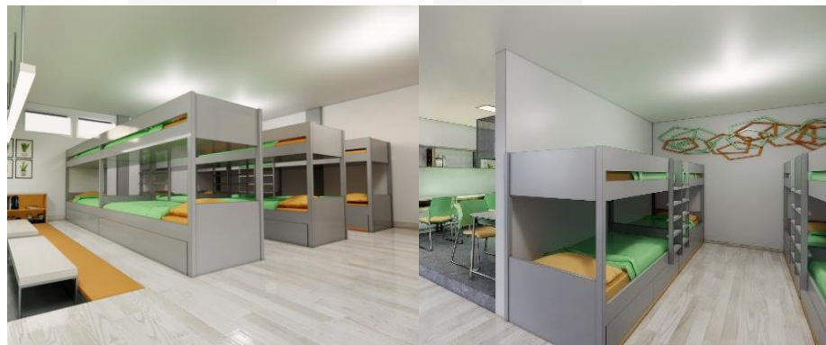
Gambar 9 Redesign Kamar Tidur Asrama Putra Tipe A

eksisting didalam kamar asrama yang digunakan, beberapa mengalami kerusakan dan tidak layak pakai. Contohnya adalah tempat tidur tingkat yang sudah tidak kokoh dan lemari yang berbeda jenis, bentuk, dan ukuran sehingga memiliki perbedaan dalam penataan furniturnya pula. Dalam hal ini, perancangan ulang kamar asrama siswa membutuhkan penyelesaian desain furniture yang dapat memberikan solusi agar kamar tidur siswa dapat terlihat lebih nyaman ditinggali, menarik dipandang, dan aman untuk digunakan. Ada beberapa penambahan juga pada kamar asrama siswa yang semula tidak menyediakan tempat belajar, kini menyediakan area belajar disesuaikan dengan tipe nya berdasarkan jumlah kapasitas siswa per ruang. Untuk perancangan asrama khusus putri, menempatkan jendela dalam posisi yang tinggi kurang lebih 180 cm dari lantai juga dapat menambah privasi dalam ruang diantaranya privasi visual, kebisingan, dan aroma(Firmansyah et al., 2021). Gambar 9 dan 10 berikut ini merupakan hasil perancangan ulang kamar tidur asrama putra, dan gambar 11 dan 12 merupakan hasil perancangan ulang kamar tidur asrama putri.