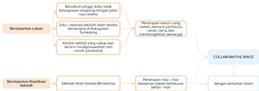
Gambar 2 Mind Mapping Tema Perancangan