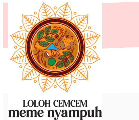
Gambar 3 Logo loloh cemcem meme nyampuh

Logo Loloh Cemcem dibuat dengan bentuk logotype yang bertujuan untuk mempermudah audience untuk mengingat merk minuman ini. Bentuk dair logotype disesuaikan sesuai dengan pola ukiran Bali yang bernama "Patra". Memiliki lekukan yang indah dan dengan sudut yang tajam.