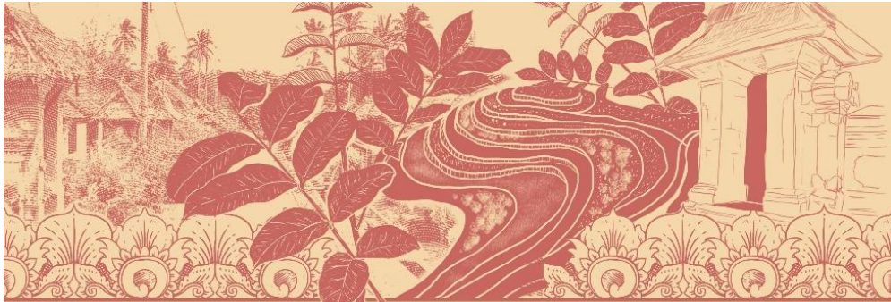
Gambar 4 Ilustrasi loloh cemcem meme nyampuh

Ilustrasi menunjukkan identitas Desa Penglipuran pada khususnya dan Pulau Bali pada umumnya. Ilustrasi menggabungkan empat aspek yang menjadi identitas Desa Penglipuran dan Pulau Bali. Terdiri atas ilustrasi sketsa dari tampak depan gapura rumah di Desa Penglipuran, digabungkan dengan ilustrasi daun cemcem itu sendiri. Ditambahkannya ilustrasi terasering atau sawah berundak dan ukiran khas Bali ditujukan sebagai aksen dari ilustrasi tersebut. Pengayaan ilustrasi terinspirasi dari Tenun khas Bali yang disebut Tenun Gringsing dan juga Endek, digabungkan dengan teknik gambar manual yang terinspirasi dari ukiran Bali.