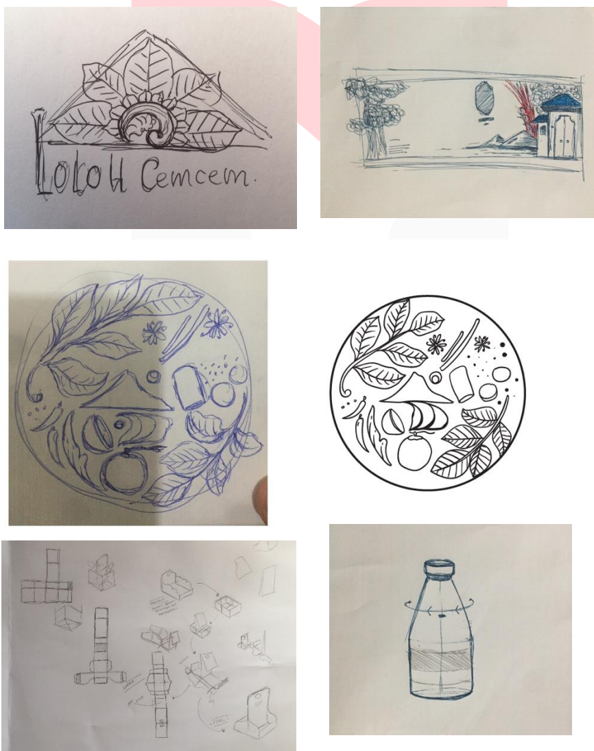
Gambar 2 Sketsa perancangan

Hasil perancangan didapatkan setelah mengumpulkan data dan observasi yang dilakukan dan tertulis di bab-bab sebelumnya serta dari konsep yang telah disusun. Berikut merupakan hasil perancangan dalam bentuk sketsa dalam perancangan identitas visual dan kemasan lolo cecem.