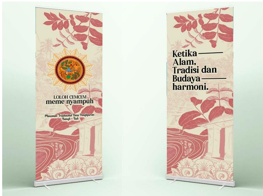
Gambar 8 Media pendukung loloh cemcem meme nyampuh