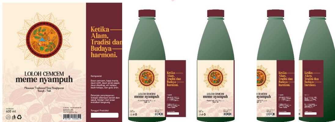
Gambar 6 Kemasan loh cecem meme nyampuh

Label kemasan loh cecem dibuat menggunakan kertas stiker dan botol pet plastik 600ml. Penerapannya dengan menggabungkan ilustrasi dan tipografi yang sesuai.