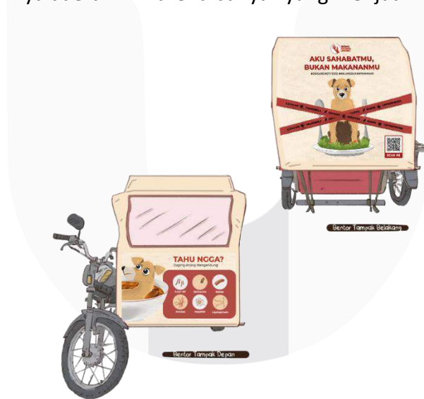
Gambar 6 Spanduk Becak Motor

Selanjutnya, kampanye ini akan dilakukan secara rutin dengan menggunakan spanduk di becak motor dan juga X-Banner yang akan digunakan pada acara talkshow . Dengan adanya media ini, masyarakat akan terus aware dan mengingat tentang bahaya mengonsumsi daging anjing. Spanduk becak motor ini akan di tempatkan di daerah Kecamatan Medan timur, Medan Tembung & Percut Sei Tuan. Dipilihnya daerah ini karena banyak yang menjual kuliner daging anjing.