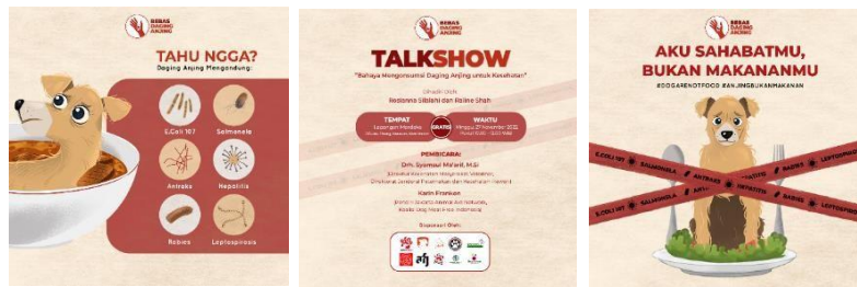
Gambar 5 Media Sosial