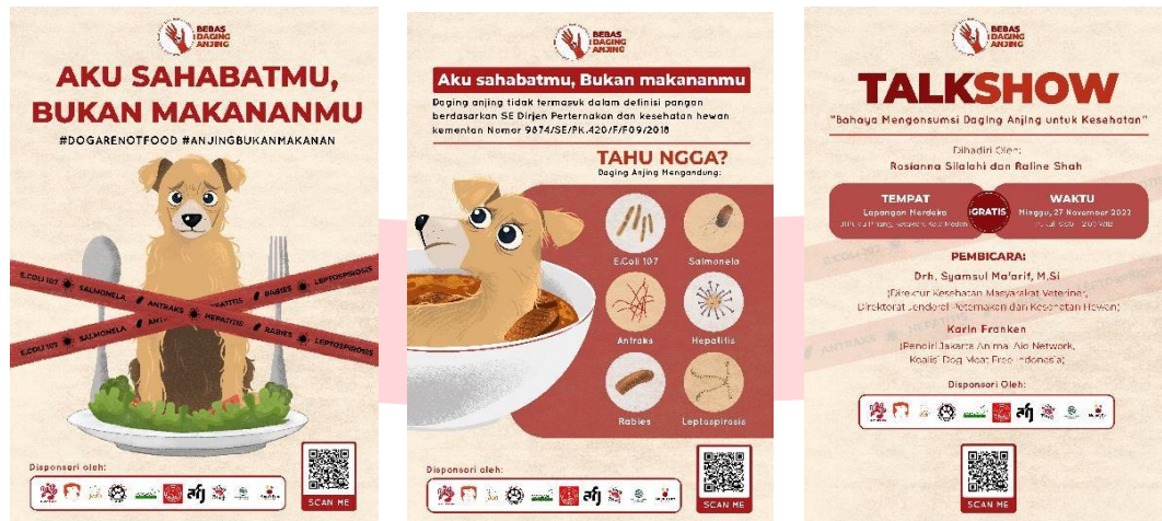
Gambar 4 Poster

pada daging anjing. Alasan memakai visual tersebut ingin memperlihatkan bahwa anjing itu tidak boleh dimakan karena memiliki banyak virus-virus yang bisa mengakibatkan infeksi hingga kematian.