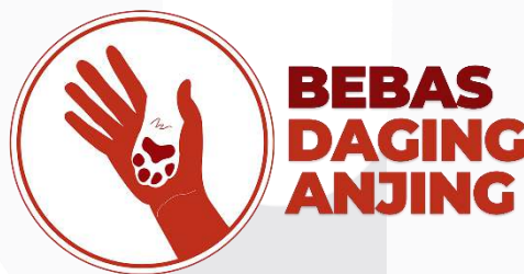
Gambar 1 Logo

Dari hasil pengumpulan data dan analisis, maka tercipta identitas visual kampanye berupa logo serta tagline dan penerapannya pada media promosi. Logo dalam kampanye ini betuliskan BEBAS DAGING ANJING sekaligus menjadi nama kampanye ini. Dalam logo ini terdapat visual tangan manusia dan kaki anjing. Alasan memakai visual tersebut karena ingin memperlihatkan bahwa anjing itu adalah sahabat bukan makanan untuk dikonsumsi.