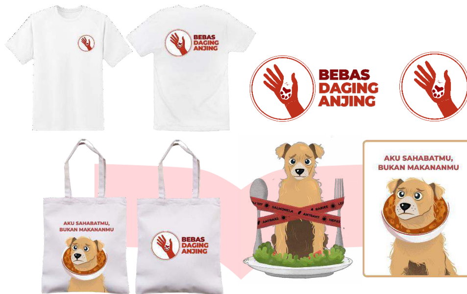
Gambar 9 Merchandise