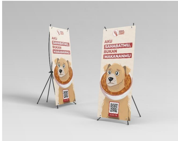
Gambar 7 X-Banner

beberapa persimpangan di Kota Medan. Media x-Banner ini digunakan sebagai media pelengkap pada setiap tempat.