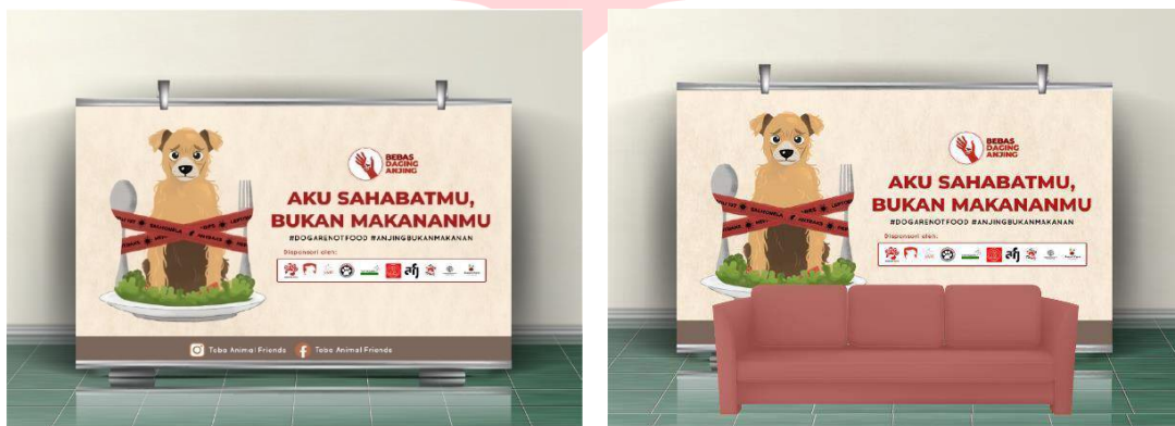
Gambar 8 Mockup event