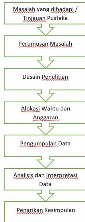
Gambar 3.1 Tahap Penelitian

Penelitian ini menggunakan metode kuantitatif dengan kuesioner sebagai teknik pengumpulan data yang disebarakan kepada karyawan Kantor Dinas Kependudukan dan Pencatatan Sipil Kota Medan sebanyak 100 orang. teknik sampling yang digunakan yaitu metode convenience sampling serta hasil uji penelitian diinterpretasikan dengan metode regresi linier berganda.