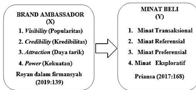
Gambar 2. 1 Kerangka Pemikiran