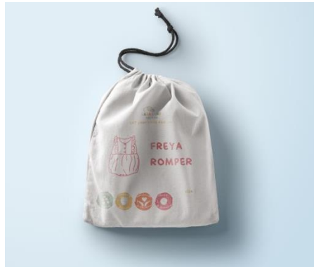
Gambar 8. Kemasan utama produk