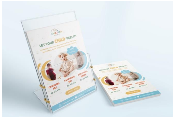
Gambar 7. Flyer