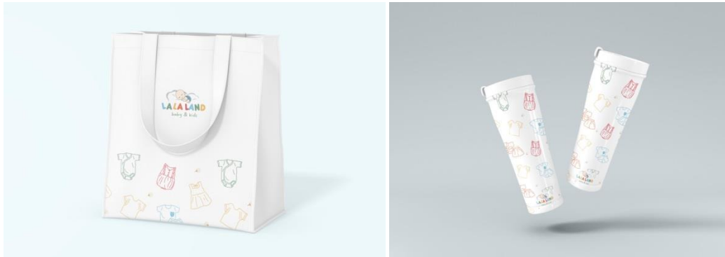
Gambar 11. Merchandise

Media promosi yang terakhir adalah stationary set . Stationary set terdiri dari kop surat, kartu nama, dan amplop. Media tersebut digunakan sebagai tanda pengenal yang terdiri dari identitas La La Land Baby & Kids untuk diberikan kepada konsumen ataupun rekan bisnis secara professional dalam keperluan usaha seperti mengirim surat secara resmi.