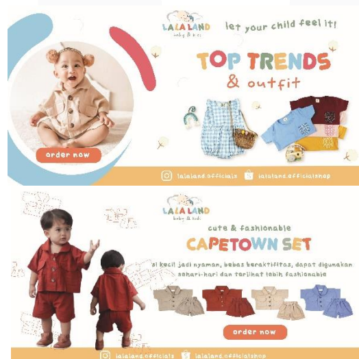
Gambar 5. Digital banner

Selain media sosial instagram, media promosi digital banner juga dibuat untuk digunakan pada media e-commerce agar menarik para target pasar saat mengunjungi toko online . Informasi yang terdapat pada digital banner adalah informing seputar produk yang ditawarkan, persuading untuk mengajak para target audien untuk mengetahui lebih dalam tentang brand dan reminding terhadap keberadaan brand .