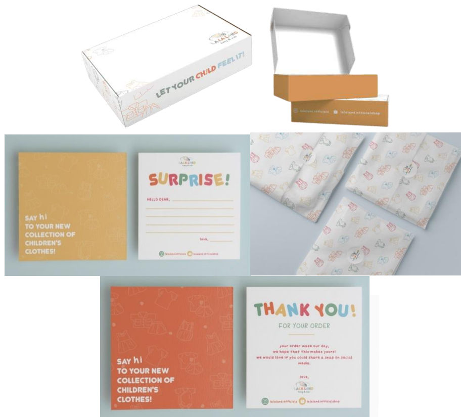
Gambar 10. Gift box set

box menggunakan bahan ivory tebal atau bisa juga dengan bahan corrugated , penggunaan bahan dapat disesuaikan dengan kebutuhan brand itu sendiri.