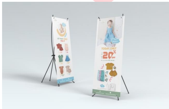
Gambar 6. Banner offline

Penggunaan media banner juga berperan dalam menarik perhatian audien karena untuk menjadi salah satu media informasi pada saat melakukan kegiatan offline seperti booth, bazar dan event tertentu lainnya. Sehingga dengan penggunaan media cetak ini dapat menjangkau para masyarakat untuk mengunjungi booth atau aware terhadap brand La La Land Baby & Kids. Pada desain banner menampilkan gambar produk yang ditawarkan dilengkapi dengan elemen visual lainnya sebagai pendukung agar membuat audien tertarik. Selain itu juga desain banner lainnya mengandung informasi yang bersifat persuading untuk mengajak dan mempengaruhi audien untuk melihat dan menggunakan produk La La Land Baby & Kids.