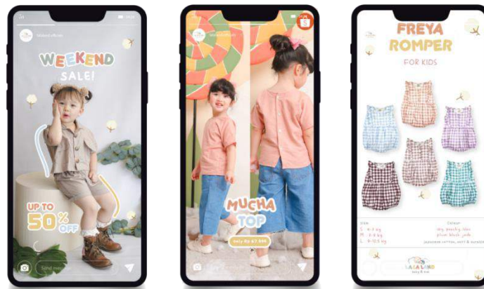
Gambar 4. Instagram stories

Selain media sosial instagram, media promosi digital banner juga dibuat untuk digunakan pada media e-commerce agar menarik para target pasar saat mengunjungi toko online . Informasi yang terdapat pada digital banner adalah informing seputar produk yang ditawarkan, persuading untuk mengajak para target audien untuk mengetahui lebih dalam tentang brand dan reminding terhadap keberadaan brand .