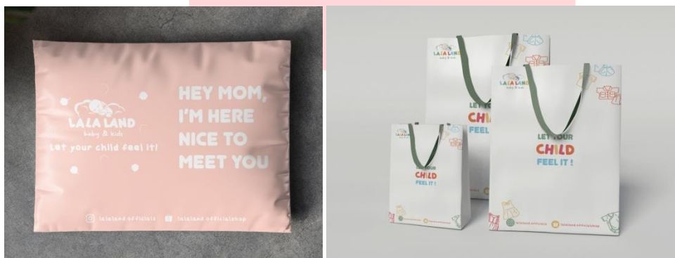
Gambar 9. Kemasan polymailer dan paper bag