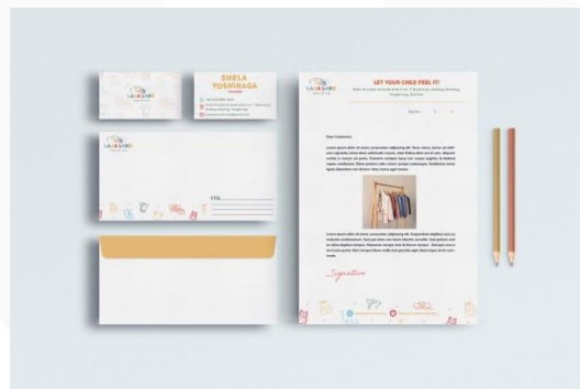
Gambar 12. Stationary Set

Media promosi yang terakhir adalah stationary set . Stationary set terdiri dari kop surat, kartu nama, dan amplop. Media tersebut digunakan sebagai tanda pengenal yang terdiri dari identitas La La Land Baby & Kids untuk diberikan kepada konsumen ataupun rekan bisnis secara professional dalam keperluan usaha seperti mengirim surat secara resmi.