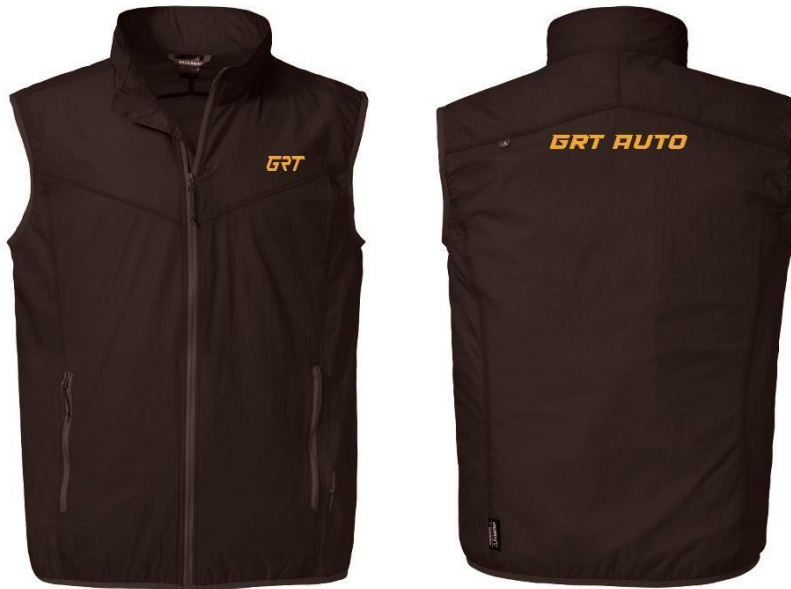
Gambar 8. Rompi windbreaker