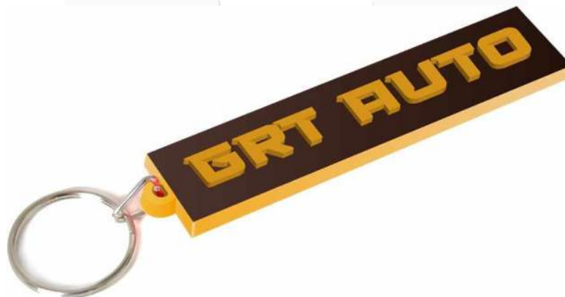
Gambar 9. Gantungan kunci