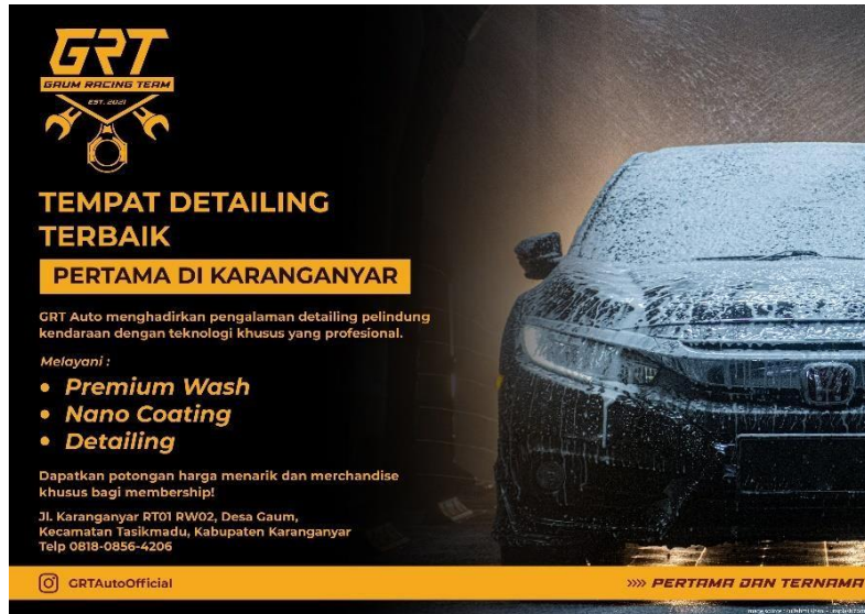
Gambar 4. Poster promosi