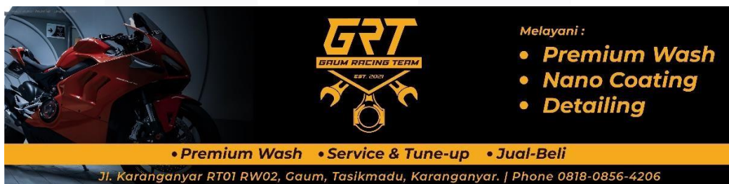
Gambar 3. Spanduk 400 cm x 100cm