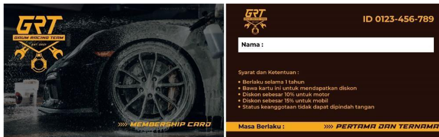
Gambar 6. Kartu Membership