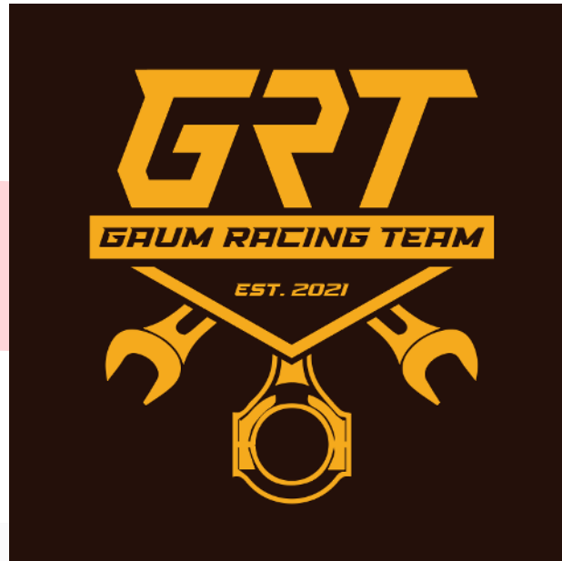
Gambar 2. Logo