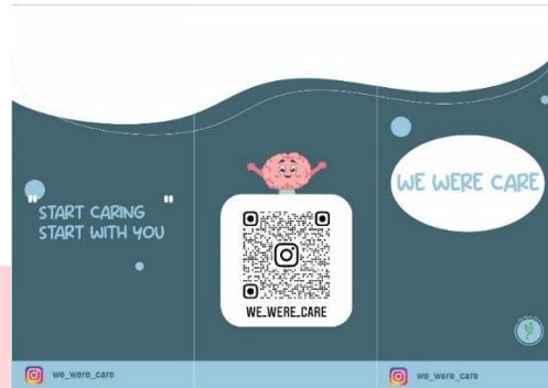
Gambar 6 Brosur bagian luar

Brosur berisikan informasi singkat mengenai kampanye ini dan pada bagian belakang brosur terdapat juga barcode yang akan langsung mengarahkan target sasaran pada IG we were care. Brosur akan dibagikan disekitar kota Bandung