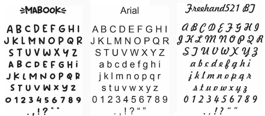
Gambar 3 Font sumber: sahrudin, 2022

Tipografi yang digunakan dalam pembuatan perancangan ini adalah sans serif dan script. Tipografi sans serif yang digunakan adalah mabook untuk bagian headline dan arial untuk bagian body text lalu font script menggunakan freehand521bt yang digunakan pada logo.