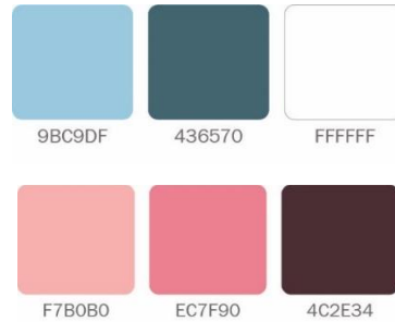
Gambar 4 Palet warna sumber : sahrudin, 2022

maskot menggunakan warna pink dikarenakan bentuk otak digambarkan dengan warna pink.