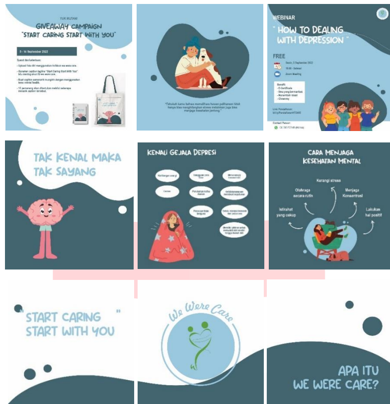
Gambar 8 Feed instagram