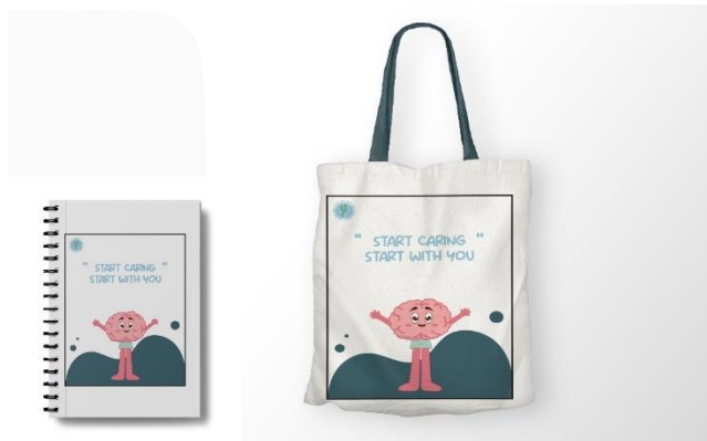
Gambar 10 Notebook dan totebag

Notebook dan totebag merupakan merchandise yang akan dibagikan kepada 10 peserta yang telah mengikuti giveaway campaign "start caring start with you" yang diadakan untuk dapat lebih banyak menarik perhatian target sasaran. Alasan penulis memilih notebook karena biasanya penderita depresi lebih suka menulis buku diary sebagai alat salur dalam menceritakan masalahnya, lalu alasan memilih totebag karena sebagai wadah dalam membawa notebook agar mudah untuk dibawa.