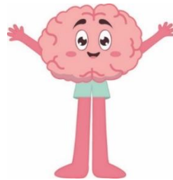
Gambar 2 Rancangan maskot