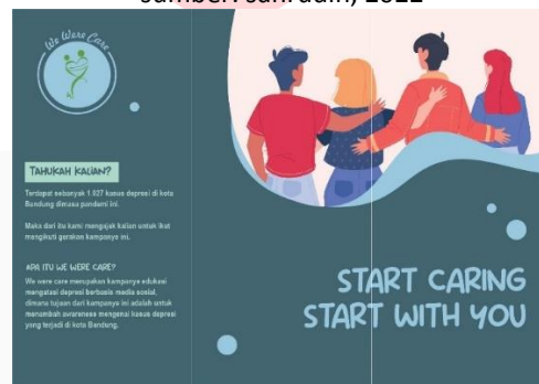
Gambar 7 Brosur bagian dalam