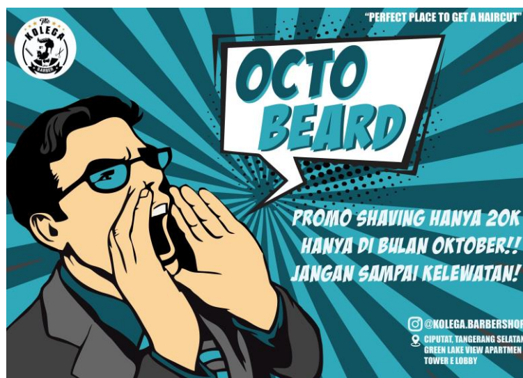
Gambar 7 Themed event octo beard

Themed event sebuah tindakan dari Kolega Barbershop untuk di Social media instagram maupun di toko. Event ini berupa promosi berjangka waktu yang di tampilkan di social media Instagram berupa event promosi yang memiliki tema yang unik dan beragam. Seperti contohnya event Octo Beard, event ini berupa event promosi yang diadakan di bulan oktober, berupa promo harga untuk jasa layanan shaving beard hanya senilai Rp20.000 yang awalnya harga untuk jasa ini adalah Rp 35.000.