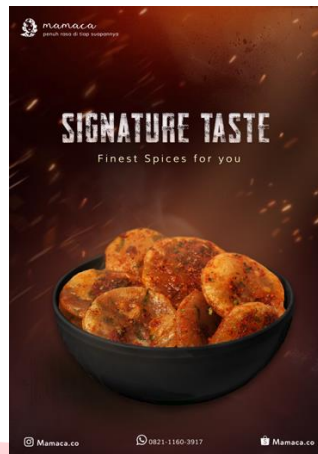
Gambar 4 Poster attention

Media digital yang dipilih untuk mempromosikan Mamaca adalah Instagram. Hal ini berdasarkan hasil survei terhadap 18 responden yang memilih Instagram sebagai media sosial yang paling banyak digunakan. Konten pada feeds Instagram berisi tentang product knowledge, foto produk serta diadakan diskon dan event yang sedang berlangsung