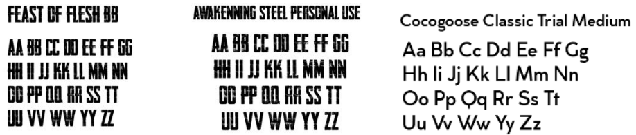
Gambar 2 Tipografi