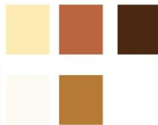
Gambar 3 Warna

Pemilihan warna tersebut berdasarkan tone warna pada produk Mamaca yaitu Tobaci dan Cipak, warna merah maroon dan coklat yang dapat memberikan kesan makanan yang pedas.