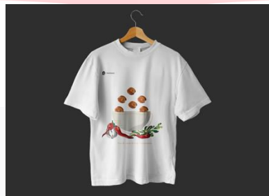
Gambar 9 Baju

Saat event dilaksanakan, karyawan Mamaca menggunakan media pendukung berupa kaos yang berisi logo acara selama acara