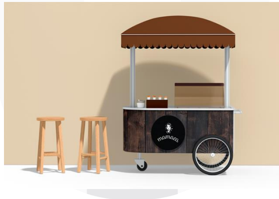
Gambar 7 Booth

Untuk memberikan informasi yang banyak, Mamaca menyediakan booth yang diletakkan di lokasi event Festival jajanan Nusantara. Selain itu target audiens juga bisa mendapatkan merchandise gratis pada saat event berlangsung.