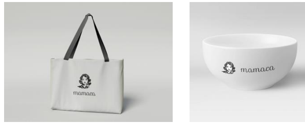
Gambar 8 Suvenir

Saat event dilaksanakan, karyawan Mamaca menggunakan media pendukung berupa kaos yang berisi logo acara selama acara