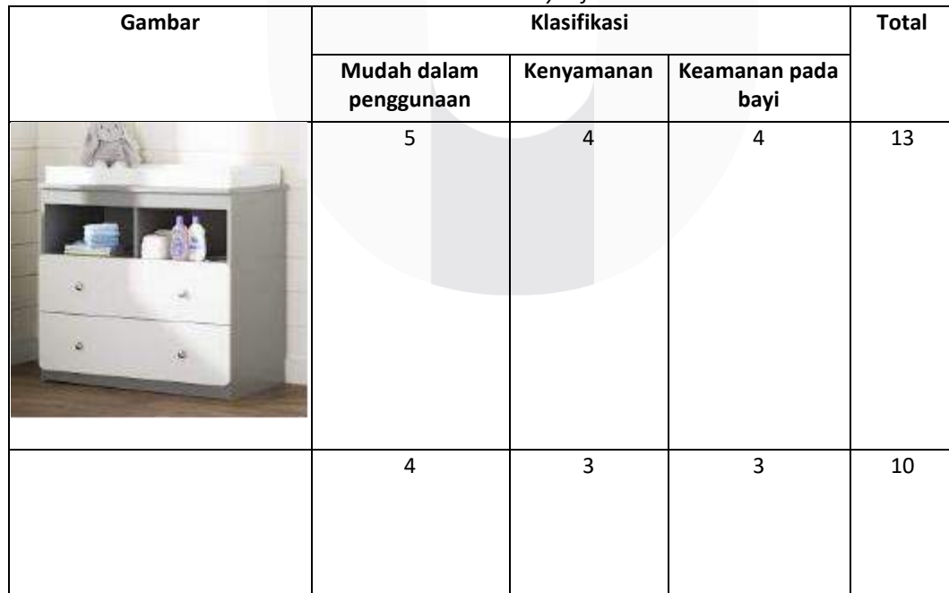
Tabel 3 Bentuk Baby tafel

Dalam perancangan baby tafel dibutuhkan parameter untuk mentukan metode dan sistem yang sesuai digunakan untuk produk, akan digunakan dengan tingkatan 1-5. Semakin besar angka yang di dapat semakin mendekati kebutuhan.