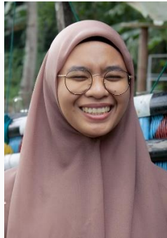
Gambar 16. Ekspresi Bahagia