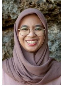
Gambar 25. Ekspresi Bahagia