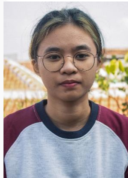
Gambar 8. Ekspresi tidak senang