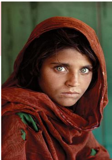
Gambar 1 Karya Steve McCurry (Sumber: National Geographic: 1985)

Penulis memilih karya Afghan girl sebagai referensi karya dikarenakan ekspresi yang ditampilkan dalam foto tersebut sangat menonjol, tegas dan terlihat sangat tajam. Dan karya ini juga merupakan salah satu contoh fotografi portrait.