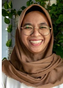
Gambar 21. Ekspresi Bahagia