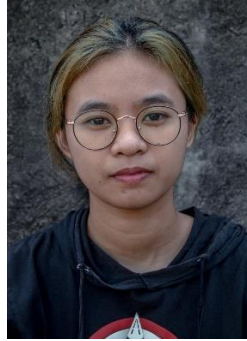
Gambar 7. Ekspresi tidak senang