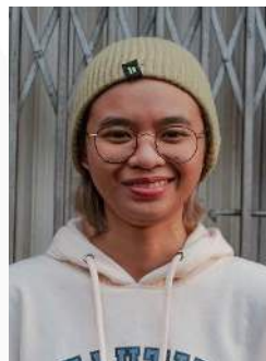
Gambar 10. Ekspresi Bahagia