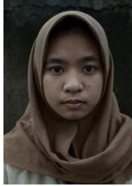
Gambar 3. Ekspresi sedih