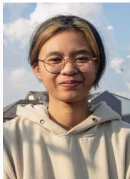
Gambar 4. Ekspresi Bahagia