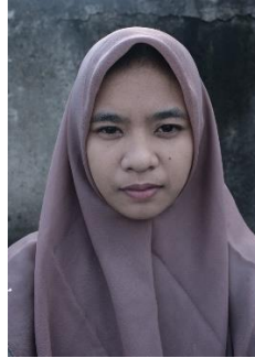
Gambar 13. Ekspresi tidak Bahagia