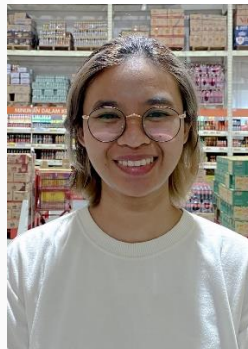
Gambar 12. Ekspresi Bahagia