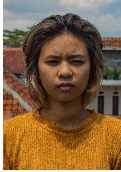
Gambar 29. Ekspresi letih