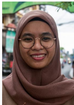
Gambar 18. Ekspresi Bahagia (sumber: dok. pribadi, 2022)