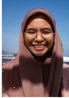
Gambar 23. Ekspresi Bahagia