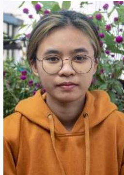
Gambar 6. Ekspresi datar