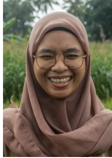
Gambar 15. Ekspresi Bahagia