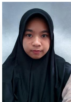
Gambar 14. Ekspresi tidak Bahagia