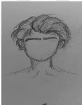
Gambar 2. Sketsa portrait