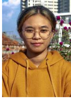
Gambar 5. Eskpresi senang