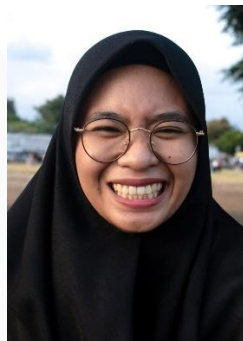
Gambar 20. Ekspresi Bahagia