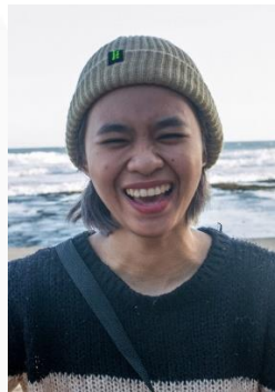
Gambar 22. Ekspresi Bahagia