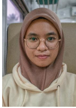
Gambar 27. Ekspresi senang