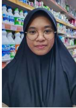
Gambar 9. Ekspresi Bahagia