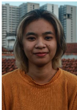
Gambar 30. Ekspresi Bahagia