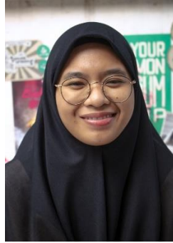
Gambar 19. Ekspresi Bahagia