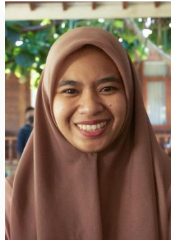
Gambar 24. Ekspresi Bahagia