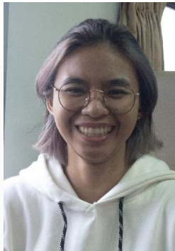
Gambar 28. Ekspresi Bahagia