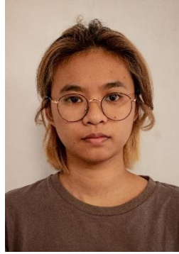
Gambar 11. Ekspresi tidak Bahagia