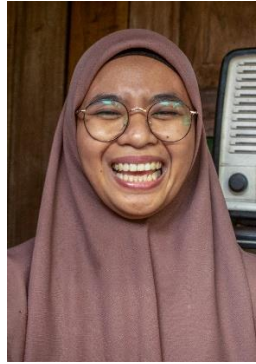
Gambar 17. Ekspresi Bahagia (sumber: dok. pribadi, 2022)