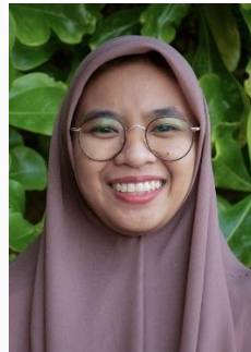
Gambar 26. Ekspresi Bahagia