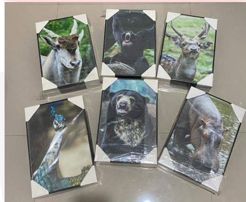
Gambar 1.7 Hasil Karya Yang Sudah Dicitak

Pada hasil keseluruhan karya yang telah penulis ciptakan dalam bentuk foto ini menunjukkan bahwa ternyata seluruh hewan yang ada di bumi ini juga memiliki berbagai macam ekspresi wajah yang bisa hewan tersebut tampilkan ataupun tunjukkan kepada manusia, dan juga dapat menjadi suatu alat komunikasi yang digunakan untuk berinteraksi kepada hewan lainnya dalam kehidupan sehari-hari hewan tersebut, sama halnya dengan apa yang dilakukan oleh manusia dalam menggunakan berbagai macam ekspresi wajah yang ditampilkan. Dimana dari setiap wajah yang ditampilkan oleh seluruh hewan juga memiliki maksud serta tujuan tersendiri. wajah yang ditampilkan pada seluruh