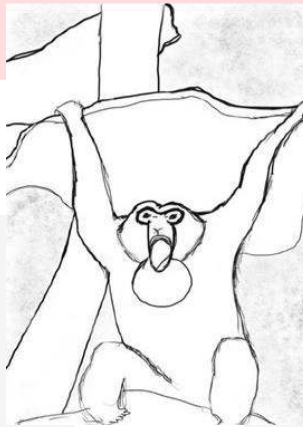
Gambar1.3 Sketsa Karya Rusa

Sebelum mendapatkan hasil foto yang diinginkan sesuai dengan tema dari pembuatan karya tugas akhir ini, penulis terlebih dahulu mempersiapkan alatnya seperti kamera dan lensa untuk mendapatkan hasil foto ekspresi pada hewan melalui proses portrait fotografi dengan menggunakan lensa fix. Setelah itu, penulis mencari objek foto yang akan di ambil gambarnya.