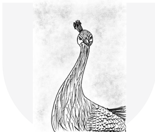
Gambar 1.1 Sketsa Karya Burung Merak