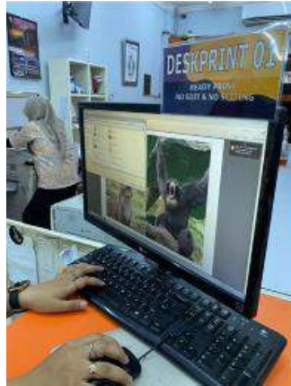
Gambar 1.6 Proses Mencetak Hasil Foto Pada Cetak Blok Yang Berukuran A4