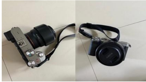
Gambar 1.4 Proses Mempersiapkan Alat untuk Proses Pengkaryaan Kamera Sony A7C dan Lensa Fix 50mm