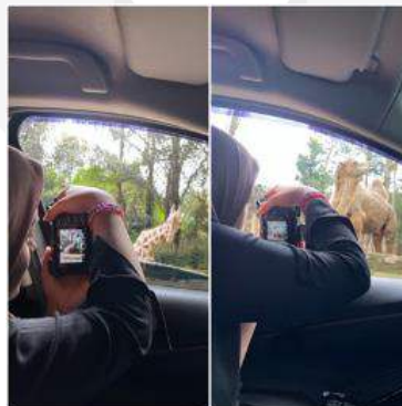
Gambar 1.5 Proses Pemotretan Subjek Foto Melalui Proses Portrait Fotografi