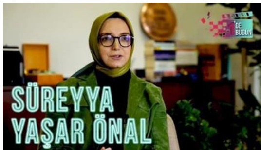
Gambar 1, Sureyya Yassar Onal

Sureyya Yassar Onal adalah Wanita berkebangsaan turki yang berprofesi sebagai penulis, sutradara dan produser film. dalam perjalanan karirnya Sureyya banyak menerima penghargaan dibidang film dokumenter, tidak hanya itu sureyya sering terlibat dalam produksi serial TV dan film layar lebar. Salah filmnya berjudul Son Muhafiz Kudus "Vatan Sinirlarini Haritalar Belirlemez" atau Penjaga Terakhir Yerusalem "Map Tidak Menentukan Batas Dunia" merupakan salah satu film yang diproduseri oleh Sureyya pada tahun 2008, yang di produksi bersama Lion Film dan Base Yapim. Film Son Muhafiz Kudus ini menceritakan tentang tentara turkey yang bertahan hingga akhir menjadi masjid Al-Aqsa dan Tanah Jerussalem, dia mewariskan dan mewasiatkan kepada anak cucunya untuk tetap menjaga kiblat pertama umat islam.