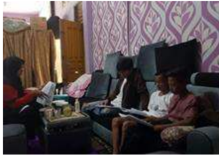
Gambar 7, Proses Produksi Film Pendek Kayuah

Proses editing film pendek “Kayuah” menggunakan software editing Adobe Premier Pro. Dengan durasi 5 menit, menggunakan aspek rasio 2.35:1 dan resolusi 2160p (4K).