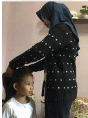
Gambar 6, Proses Produksi Film Pendek Kayuah

Proses produksi di lapangan sering terjadi perubahan dari apa yang direncanakan sebelumnya, maka dari itu sutradara perlu memberikan keputusan yang bijak apabila terjadi sesuatu yang tidak sesuai dengan rencana awal.