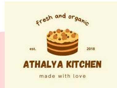
GAMBAR 1 LOGO ATHALYA KITCHEN

Target dari Athalya Kitchen sendiri adalah untuk anak-anak, mahasiswa, karyawan/pegawai kantor hingga ibu-ibu. Karena segmen ini sangat tepat, bila dilihat dari segi tren anak muda masa kini yang gemar dengan makanan berpenampilan modern dan praktis, maka bisnis kuliner ini pasti banyak digemari. Selain itu, produk dari Athalya Kitchen juga sangat cocok untuk dihidangkan saat perayaan hari besar seperti hari raya idul Fitri dan acara natal akhir tahun. (Data Perusahaan, 2022).