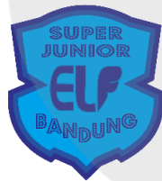
Gambar 1.1 Logo Komunitas ELF Bandung

Selain sebagai kartu identitas anggota resmi komunitas ELF Bandung, id card member tersebut juga memiliki fungsi sebagai alat potong harga/diskon belanja di KpopAddict Shop dengan syarat dan ketentuan berlaku, dan diskon untuk harga tiket masuk di cara gathering ELF Bandung yang diadakan tiap tahun. Hingga kini, bukan hanya ELF yang berasal dari Bandung saja yang berada di bawah komunitas ELF Bandung, tapi terdapat pula ELF yang berasal dari daerah lain di sekitar Bandung, seperti Cimahi, Garut, dan Majalaya (sumber dari arsip proposal kegiatan gathering '7 Years of Love' oleh ELF Bandung).