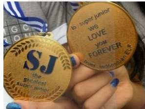
Gambar 1.2 Medali Emas dari ELF Indonesia

Berkaitan dengan topik penelitian mengenai perubahan identitas diri dan gaya hidup, salah satu contoh nyata adalah ELF dari Indonesia rela mengeluarkan uang dan waktunya demi menonton langsung konser Super Junior Super Show 3 Singapura (SS3 Singapura) tanggal 29-30 Januari 2011. Menurut berita yang tersebar di media massa didukung oleh pernyataan Indra Herlambang dan Vidi Aldiano yang turut menonton konser SS3 Singapura (Insert Pagi TransTV, 2011) bahwa 60% yang menonton konser tersebut adalah orang Indonesia (dkpopnews.net, 2011). ELF Indonesia yang menonton ke sana membawa hadiah istimewa berupa medali emas berjumlah sepuluh medali (karena pada saat itu hanya sepuluh anggota yang hadir di Super Show 3 Singapura) dan juga satu baju batik serta blangkon. Setiap medali berharga sekitar $442.77 (sekitar empat juta rupiah).