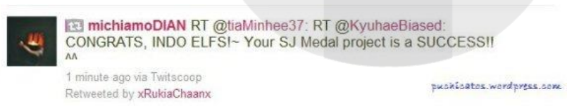
Gambar 1.3 Tweet Medali Emas dari ELF Indonesia ke SS3 Singapura