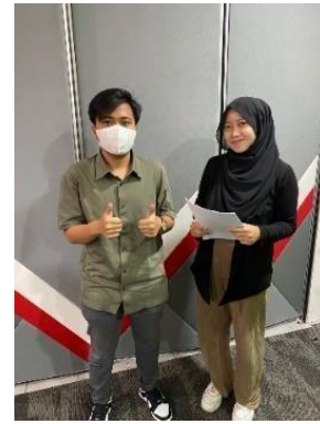
GAMBAR 6 WAWANCARA 5