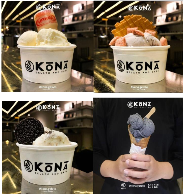
Gambar 1.3 Macam – macam varian rasa gelato (kona gelato & coffee)