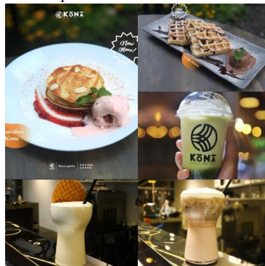
Gambar 1. 5Refreshment & dessert