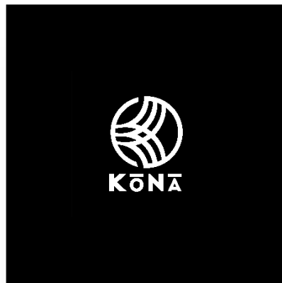
Gambar 1. 1 Logo Kona Gelato & Coffee Cimahi