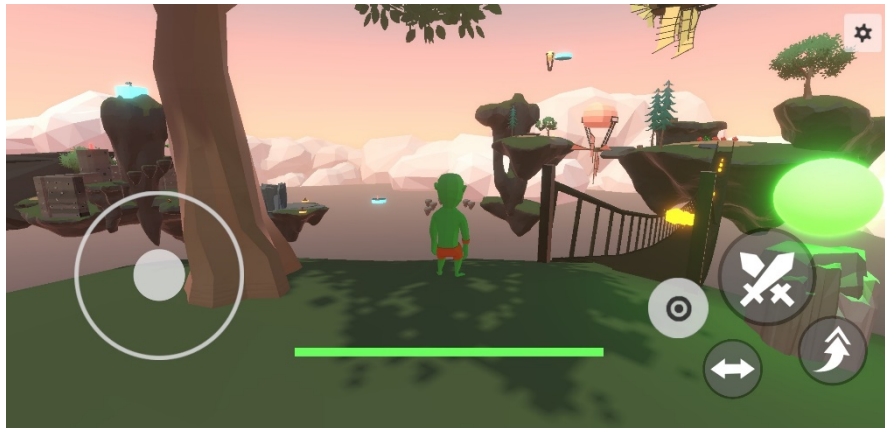
Gambar 1.2 Screenshot Goblin Adventure