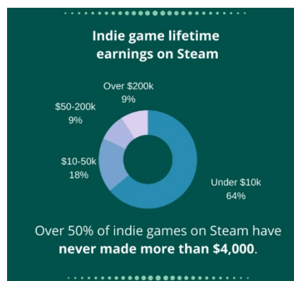
Gambar 1.4 Pendapatan Lifetime Indie game

Terdapat fenomena yang terjadi di indie game development dimana mayoritas indie game development banyak yang berujung gagal secara finansial. Dalam sebuah interview yang dilakukan Into Indie Game (2020), Justin French, CEO dari Dream Harvest mengatakan rata-rata game di platform steam menghasilkan kurang lebih $16K di tahun pertama penjualannya, Game-game ini tidak pernah menghasilkan pendapatan yang cukup untuk menutupi waktu pengembangan dan biaya lainnya mengingat development game mengambil waktu yang lama dan gaji pegawai juga tidak murah. Data pendapatan Lifetime Indie game dapat dilihat pada pada Gambar 1.3.