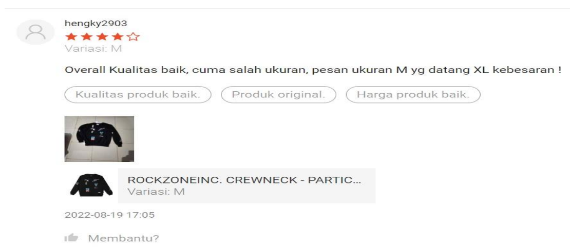
Gambar 1. 3 Keluhan pelanggan terhadap Rockzoneinc

Akan tetapi Rockzoneinc menghadapi banyak kendala seperti terhambatnya pesanan dikirim, orderan tidak sesuai dengan stock yang tersedia, desain konsep yang masih belum jelas sehingga perlu adanya strategi yang jelas untuk value proposition . Selain itu pada blok Key Activities terdapat keluhan pelanggan yang disampaikan seperti pesanan yang tidak sesuai atau pesanan terlambat sehingga pelanggan membutuhkan waktu lebih untuk menggunakan produk yang telah dipesan. Dengan mempunyai produk yang berciri khas dengan bahan Superior Soft Cotton membuat model bisnis Rockzoneinc mempertimbangkan perlu ada tindak lanjut untuk merancang model bisnisnya dengan menemukan dan memahami karakter (ciri khas), nilai yang akan ditawarkan kepada konsumen serta memahami segmen konsumen sehingga dapat bertahan dalam persaingan dalam dunia bisnis clothing line . Keluhan pelanggan dapat dilihat pada Gambar 1.3.