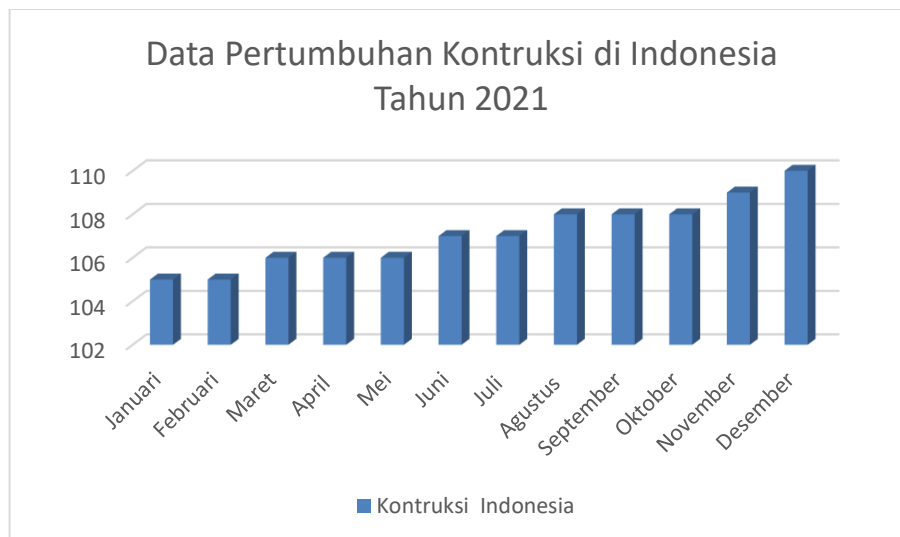
Gambar I.1 Data pertumbuhan kontruksi di Indonesia

Perkembangan proyek konstruksi di Indonesia semakin berkembang pesat. Proyek konstruksi berkaitan dengan jumlah proyek infrastruktur dan bangunan yang dapat memajukan kesejahteraan ekonomi penduduknya dengan tersedianya fasilitas infrastruktur seperti gedung perkantoran, akses jalan yang memadai dan infrastruktur lainnya yang menunjang aktivitas penduduk sebagai pelaku ekonomi (Badan Pusat Statistik, 2021). Lembaga World Economic Forum (WEF) dalam Global Competitiveness Report 2015-2016 menyatakan bahwa Indonesia merupakan negara dengan urutan ke-62 dari 140 negara perihal pembangunan infrastruktur (WEF, 2016). Pembangunan infrastruktur dengan kemajuan ekonomi memiliki korelasi yang sangat erat. Pembangunan infrastruktur merupakan salah satu faktor yang membuat ekonomi semakin maju, dimana kemajuan ekonomi tersebut menimbulkan kebutuhan akan tingginya infrastruktur dalam proses perekonomian. Berdasarkan data Badan Pusat Statistik (BPS), pertumbuhan ekonomi Indonesia mengalami peningkatan pada kuartal III-2021 sebesar 3,51 persen. Hal ini berjalan seiringan dengan pertumbuhan proyek konstruksi di Indonesia (Badan Pusat Statistik, 2021). Data pertumbuhan proyek konstruksi di Indonesia tersaji pada Gambar I.1