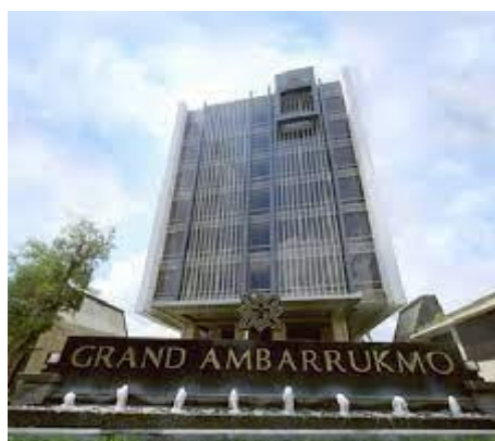
Gambar 1.1 Gambar Hotel Grand Ambarrukmo

Yogyakarta adalah kota wisata dan budaya banyaknya wisata dan budaya di Yogyakarta menjadikan bisnis dan pelayanan akomodasi hotel sangatlah banyak salah satunya adalah Hotel Grand Ambarrukmo Yogyakarta. Hotel Grand Ambarrukmo sendiri terletak pada Jl. Laksda Adisucipto No.82, Ambarukmo, Caturtunggal, Kec. Depok, Kabupaten Sleman, Daerah Istimewa Yogyakarta, tepatnya di depan Ambarrukmo Plaza. Hotel Grand Ambarrukmo sendiri diresmikan oleh pemerintah kota Yogyakarta pada tanggal 22 Juli 2022.