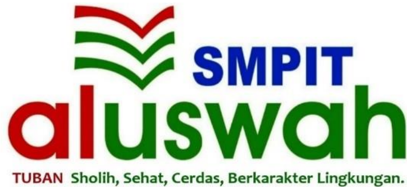
Gambar 1. 1