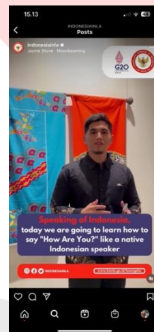
Gambar 9. Konten Edukasi