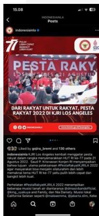
Gambar 12. Konten Hiburan