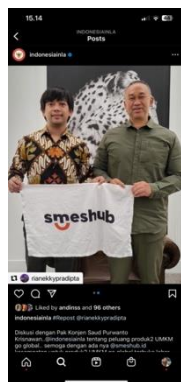
Gambar 5. Konten Kolaborasi