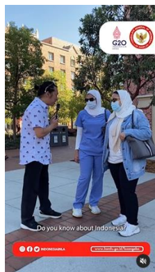
Gambar 10. Konten Hiburan