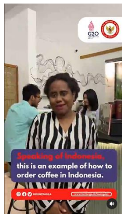
Gambar 8. Konten Edukasi