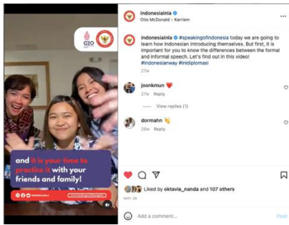
Gambar 7. Konten Edukasi