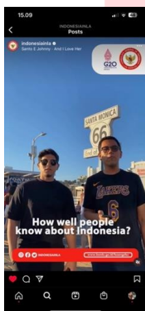
Gambar 11. Konten Hiburan