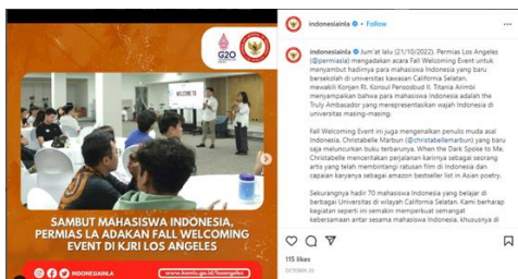
Gambar 4. Konten Kolaborasi