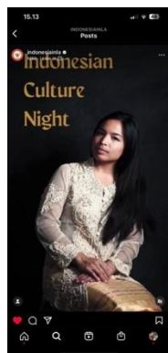
Gambar 6. Konten Kolaborasi