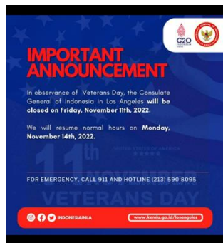
Gambar 1. Konten Komunikasi

Untuk mengetahui bentuk komunikasi yang dilakukan oleh Konsulat Jendral Republik Indonesia di Los Angeles dalam media sosial Instagramnya, peneliti memulai dari beberapa pertanyaan yang berkaitan baik dari segi bentuk interaksi yang dilakukan, apakah Instagram digunakan sebagai sarana komunikasi dan informasi, bagaimana pertimbangan pemilihan konten informasi, apa saja media sosial yang digunakan, bagaimana cara pengelolaan pesan, apakah media sosial sebagai sarana kritik dan saran, saluran media komunikasi utama yang digunakan, dan mengapa saluran tersebut dipilih karena komponen tersebut komunikasi dapat Membangun Interaksi dengan audiens dan menyampaikan konten informasi tentang institusi atau brand. Aspek komunikasi yang baik yaitu mampu membangun percakapan dengan audiens, karena kita tidak dapat mengontrol interaksi dan percakapan pada media sosial, yang dapat dilakukan hanyalah mempengaruhi audiens tersebut (Lon Saffo dan David K. Brake, 2009).