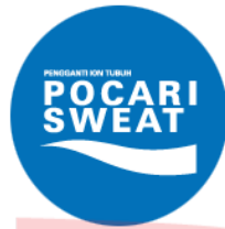
Gambar 1.2 Logo Pocari Sweat

melalui keringat. Komposisi pocari sweat sama dengan cairan tubuh dengan kandungan elektrolit yang seimbang. Sehingga Pocari Sweat diproduksi untuk menghindari kekurangan kandungan elektrolit dalam tubuh dan mengembalikan cairan tubuh secara menyeluruh sehingga membuat tubuh menjadi lebih segar dan sehat.