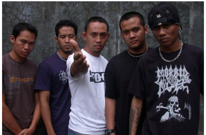
Gambar 1.7 Band Burgerkill (Old School Hardcore Era)