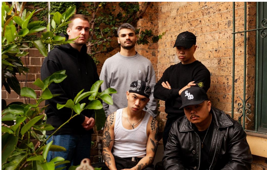
Gambar 1.12 Band Speed