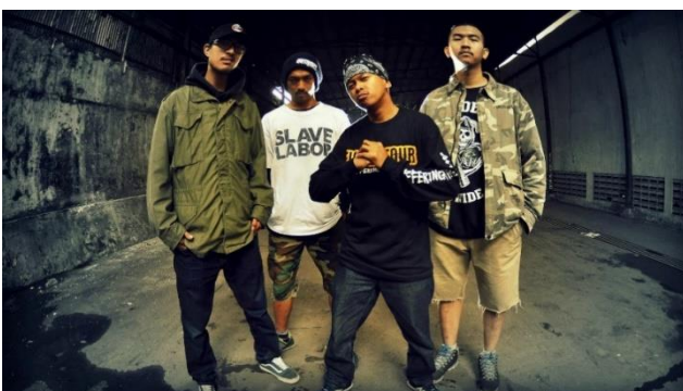
Gambar 1.10 Band Oldschool Hardcore Outright