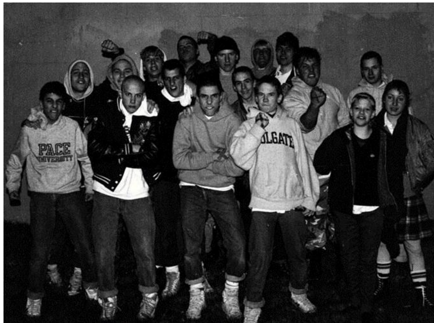
Gambar 1.1 Fesyen Hardcore

Penggemar music hardcore identik dengan fesyen atau gaya berbusana yang khas. Menurut Iyas Lawrence (2018) dari segi fesyen, hardcore memiliki ciri khas, yaitu mulai dari celana camo , jaket studded , sepatu boots dan kets yang dikombinasikan crewnecks dan celana youth crew set .