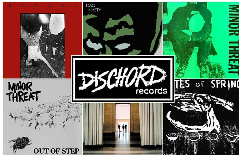
Gambar 1.2 D.C Hardcore by Dischords Records