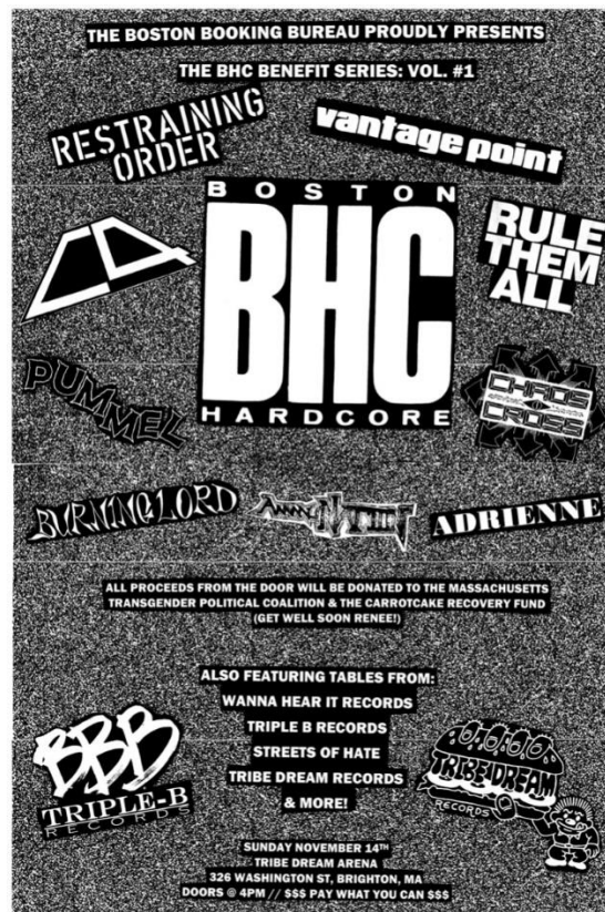
Gambar 1.4 Boston Hardcore