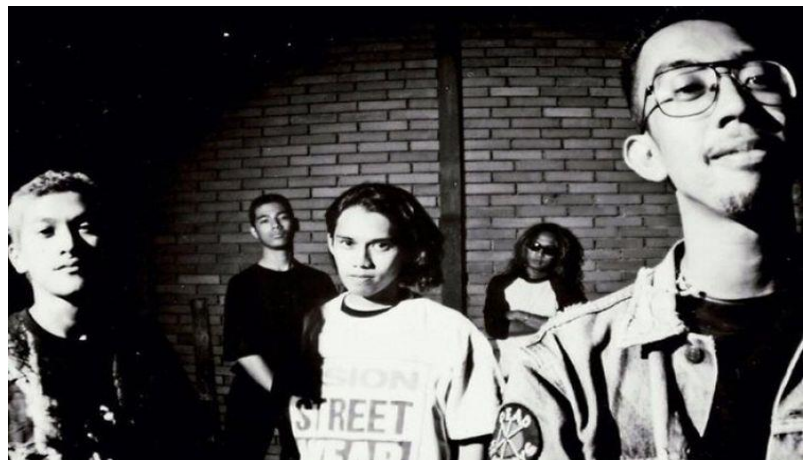
Gambar 1.9 Band Old School Hardcore Puppen