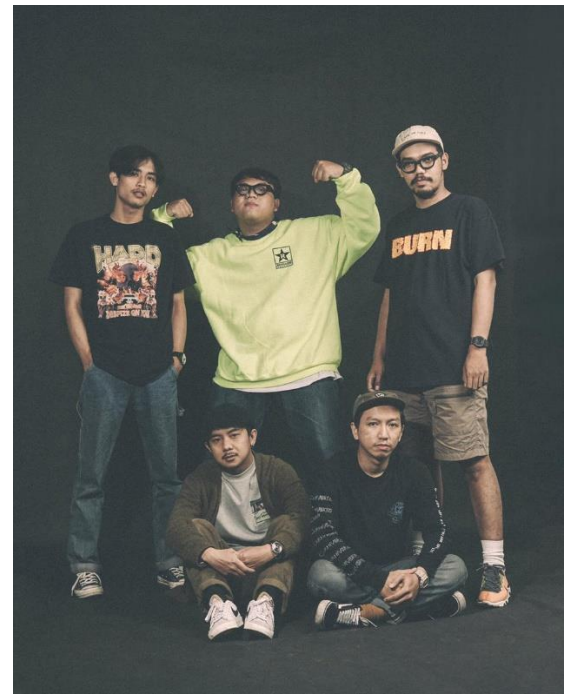
Gambar 1.14 Band New School Hardcore Prejudize

Kemudian Bandung memiliki support system yang baik dalam skena dan komunitas musik hardcore, seperti label rekaman Greedy Dust dan Disaster Records. Selain itu Bandung memiliki clothing brand yang selalu mendukung acara musik hardcore, Maternal Disaster dan Husted Youth. Dengan melihat penjelasan yang terlampir di atas, fesyen hardcore memiliki keidentikan. Hal tersebut menjadi acuan pada sifat pola konsumsi sebagai sistem simbol mendasari pandangan fesyen sebagai upaya untuk mengkomunikasikan citra seseorang (Sklar and Donahue, 2018). Penggunaan pakaian untuk mempresentasikan sebuah citra adalah sebuah metode untuk membela suatu kasus harga diri yang tinggi dalam masyarakat, dan dalam kasus hardcore, yaitu untuk mengungkapkan kedalaman dan keaslian. Proses perilaku konsumen hardcore adalah tentang subjek tetapi juga tindakan mengkomunikasikan pesan. (Yuniya Kawamura, 2005) menjelaskan bahwa individu menggunakan konsumsi sebagai sinyal norma bersama yang disepakati dalam suatu kelompok. Dalam hardcore ada beberapa kesesuaian tujuan serta individualitas minimal. Orang-orang dalam subkultur hardcore mengakui bahwa mereka menyesuaikan diri dengan gaya yang seragam, dan bahwa lebih penting untuk terpisah dari massa dan terikat dengan orang lain di dalam skena hardcore.