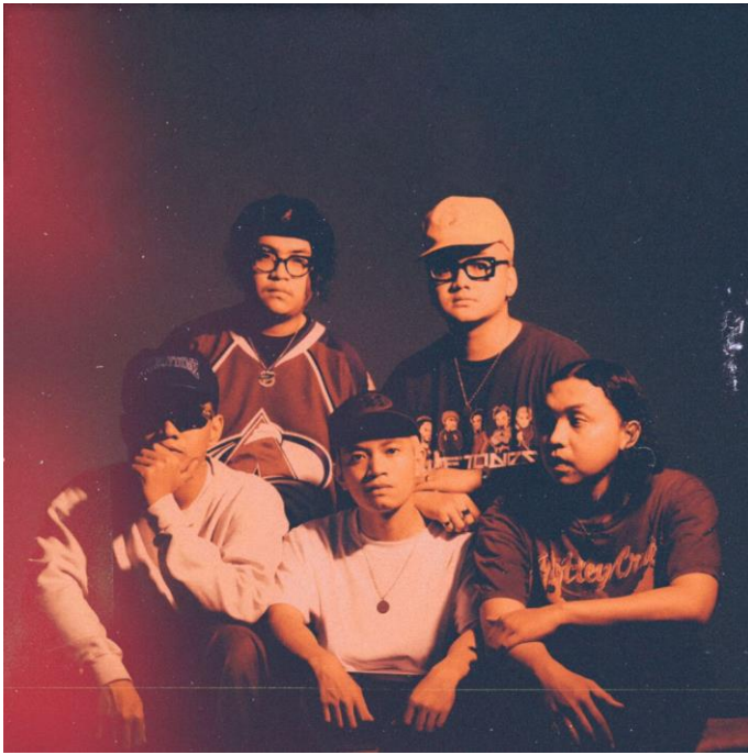
Gambar 1.13 Band New School Hardcore Bleach