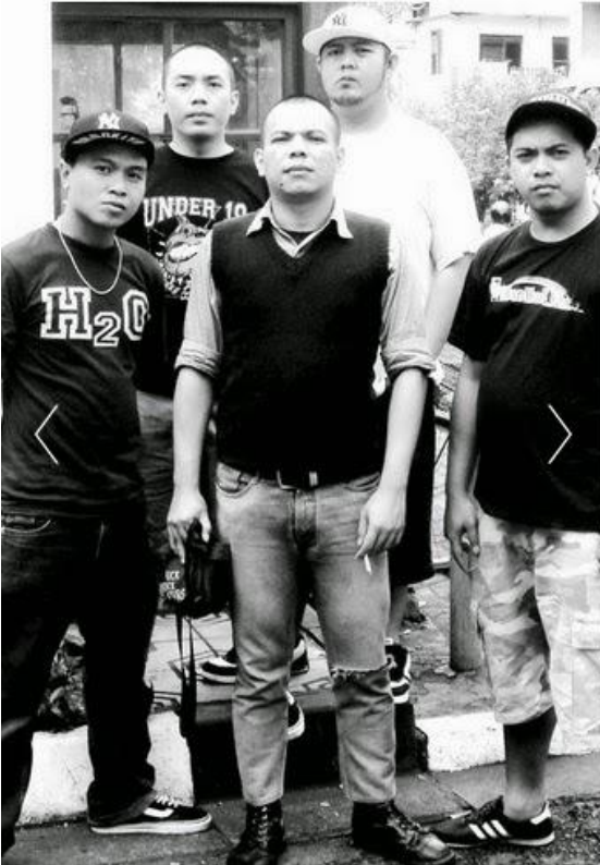
Gambar 1.8 Band Old School Hardcore Under 18

Cikapundung, Toko Buku Impor Qta, kaset rekaman bajakan legal di Jalan Cihapit, dan kemunculan Majalah Aktuil yang menjadi majalah musik pertama di Indonesia. Kemudian Bandung memiliki band-band tersohor dalam skena musik hardcore. Band hardcore di Kota Bandung memiliki dua era, yang pertama era old school dan kedua era new school.