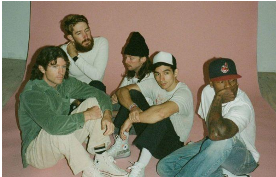
Gambar 1.11 Band Turnstile

Fase oldschool hardcore di Kota Bandung tentunya dipengaruhi juga oleh band-band hardcore oldschool luar negeri, seperti Black Flag, Youth Of Today, Gorilla Biscuits, dan Bold. Fesyen hardcore mengalami beberapa transformasi, tergantung band atau musisi yang menyebarkannya. Penting untuk diingat bahwa proses fesyen memengaruhi semua tipe fenomena budaya, termasuk musik. Seperti yang dicontohkan pada era hardcore new school oleh band Turnstile, Speed, dan lainnya juga menginspirasi band-band hardcore Kota Bandung saat ini.