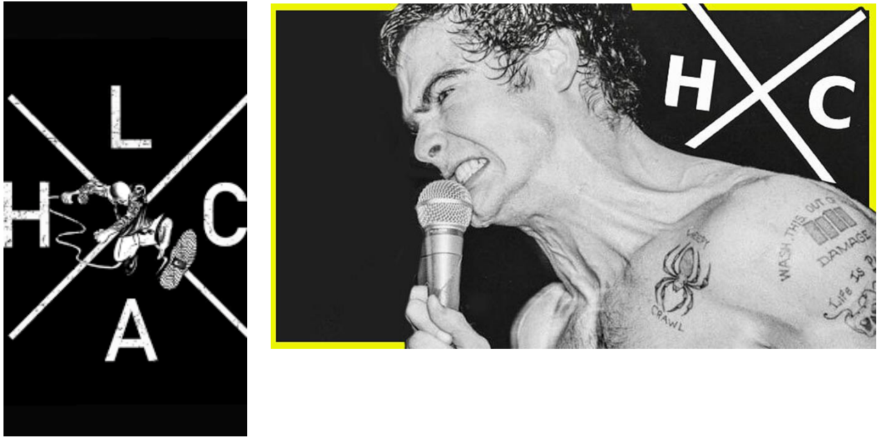
Gambar 1.5 Los Angeles Hardcore by Black Flag