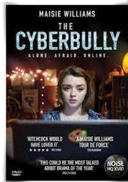
Gambar 1 Cyberbully

Pada perancangan iklan ini, penulis memilih beberapa karya sejenis untuk menganalisis dan juga untuk referensi dalam perancangan, diantara adalah sebagai berikut: