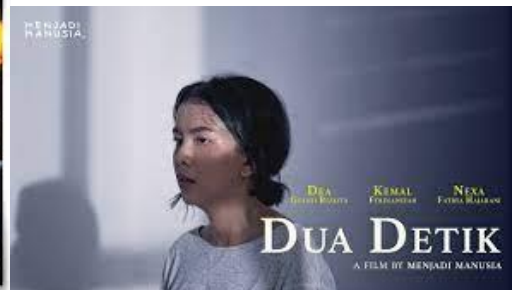
Gambar 2 Dua Detik