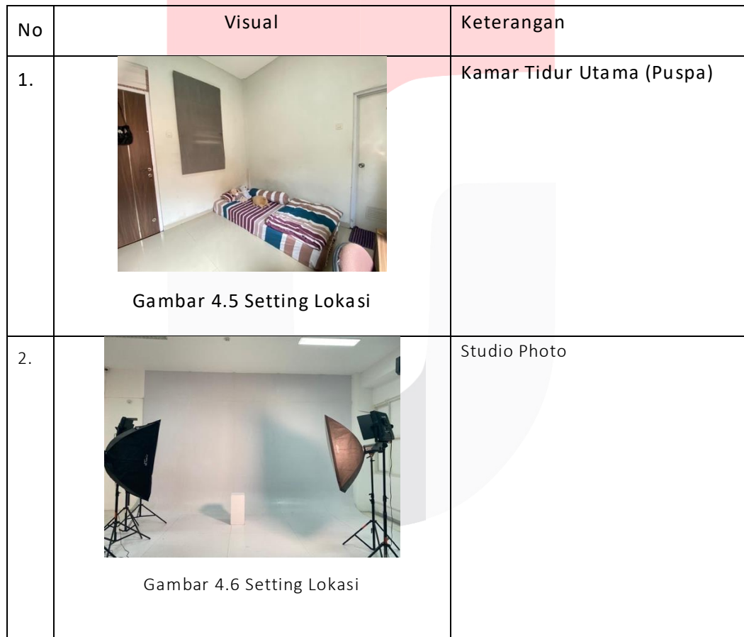
Tabel 3 Gambar Visual dan Keterangan Setting Lokasi

Berdasarkan konsep dalam film yang memiliki fokus pada cerita kehidupan Puspa yang memiliki pekerjaan sebagai model ini, maka dari itu setting lokasi yang penulis tawarkan hanya rumah dengan satu ruangan dan outdoor caffe yang digunakan pada pembuatan iklan ini.