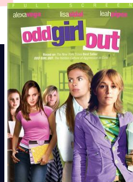
Gambar 3 Odd Girl Out