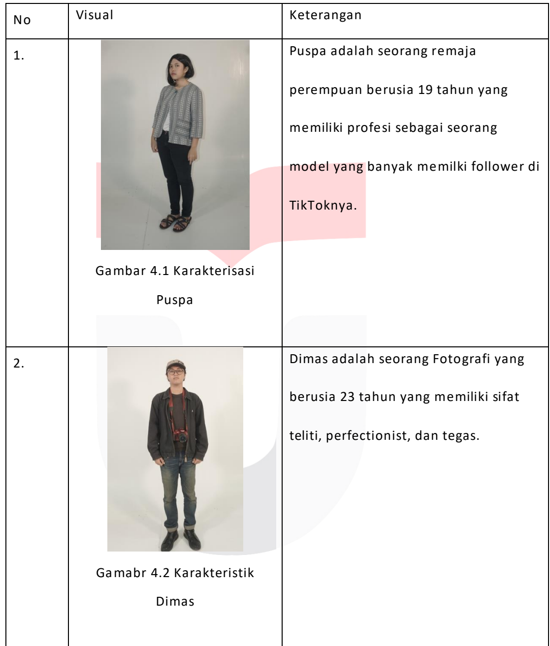
Tabel 2 Gambar Visual dan Keterangan Karakterisasi