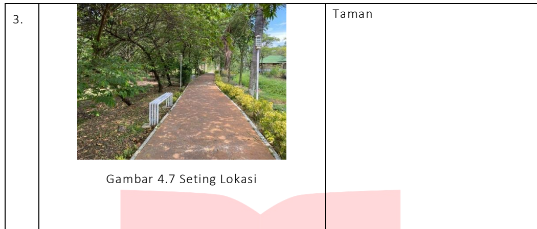
Gambar 4.7 Seting Lokasi