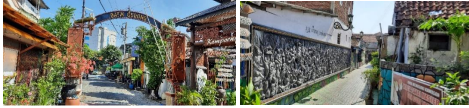
Gambar 1.1 Lingkungan Kampung Batik Semarang

Akan tetapi, Kampung Batik Semarang masih belum menonjolkan identitasnya yang membuat menjadi berbeda dengan kampung batik lainnya dan belum mempunyai identitas visual, untuk pemasarannya dilakukan acara beberapa bulan sekali oleh pemerintah dan kurang tepat sasaran karena tidak semua pengrajin memiliki akses peluang pasar yang sama, selain itu pengrajin atau pedagang lain menjual secara individu (Tamaya dkk, 2013:9). Terlihat masih kurang dalam melakukan memperkenalkan kampung ini sehingga banyak orang yang belum mengetahui Kampung Batik Semarang. Dengan mengambil topik identitas destinasi wisata Kampung Batik Semarang, diharapkan Kampung Batik Semarang dapat menjadi lebih dikenal banyak orang, orang-orang dapat mengetahui dan mengunjungi untuk membeli ataupun belajar membuat batik sehingga penduduk Desa Kampung Batik Semarang yang mata pencahariannya sebagai pengrajin dan pedagang tidak mengalami kerugian, ditambah lagi karena adanya pandemi Covid- 19 yang membuat pengunjung tambah berkurang dan sekaligus membuat batik Semarangn semakin dikenal dan dapat dilestarikan.