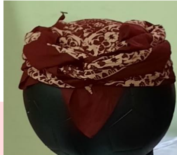
Gambar 15 Ikat kepala