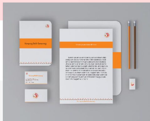
Gambar 6 Stationery

Menggunakan stationery sebagai media pendukung, keperluan alat tulis dan lainnya yang meliputi kartu nama, buku, kertas, map dan alat tulis untuk pengurusan Kampung Batik Semarang dengan adanya unsur-unsur grafis dari desain identitas visual Kampung Batik Semarang. Dapat digunakan sebagai keperluan dalam pengurusan Kampung Batik Semarang.