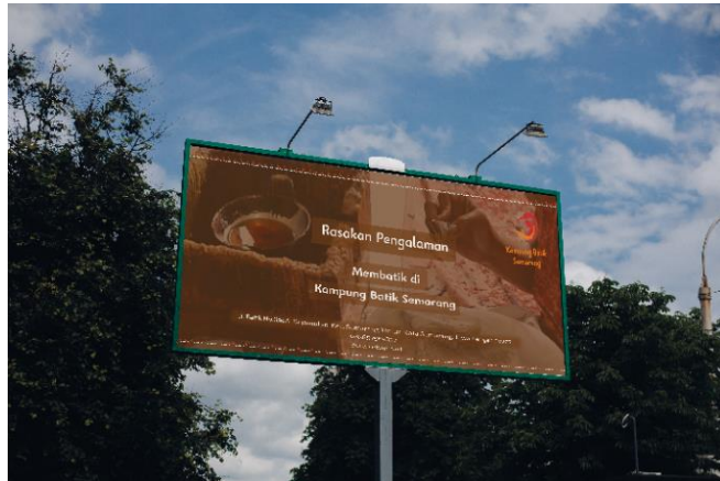
Gambar 4 Billboard

Menggunakan billboard yang berukuran besar dengan ukuran 4x8 meter untuk menarik perhatian masyarakat karena sering ditemui pinggir jalan dengan letak yang strategis, memberikan informasi singkat dan ajakan kepada masyarakat ketika melihatnya untuk mengunjungi Kampung Batik Semarang.