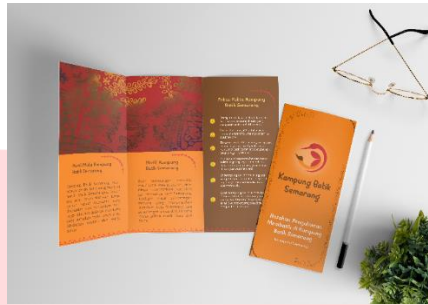
Gambar 2 Brosur