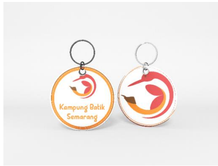
Gambar 7 Gantungan Kunci