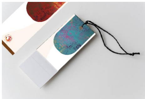
Gambar 8 Pembatas Buku