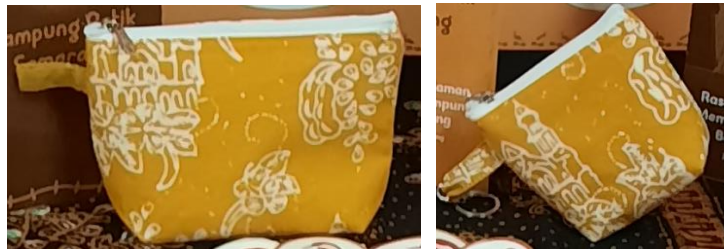
Gambar 16 Dompot kecil