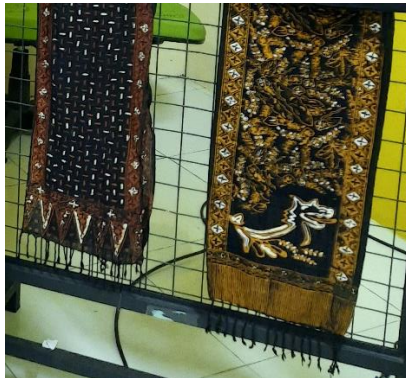
Gambar 14 Syal