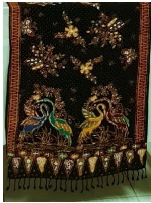
Gambar 13 Selendang