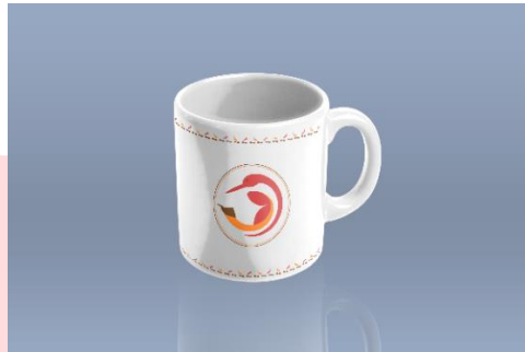
Gambar 20 Mug