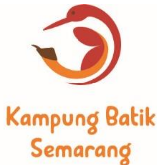
Gambar 1 Logo

Identitas visual berupa logo yang dirancang sesuai data yang didapat sehingga dapat menjadi identitas visual Kampung Batik Semarang dan dapat diimplementasikan pada media pendukung.