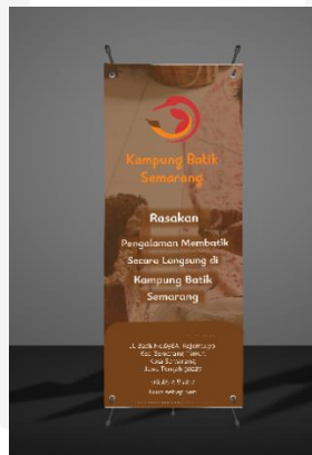
Gambar 3 X-Banner