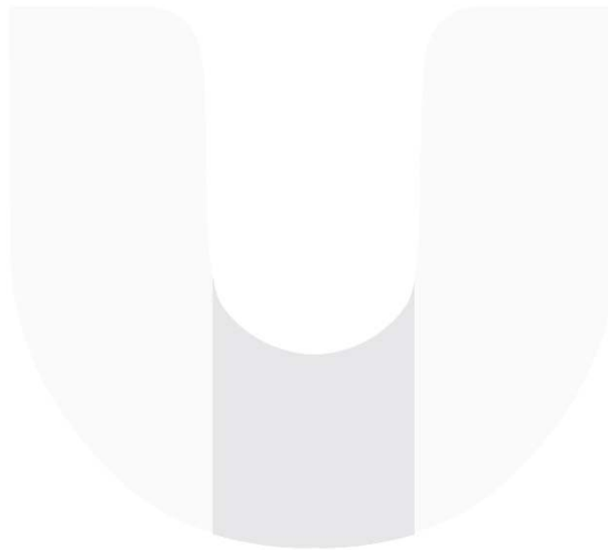
Gambar 3 Hasil perancangan logo EPIC Consulting