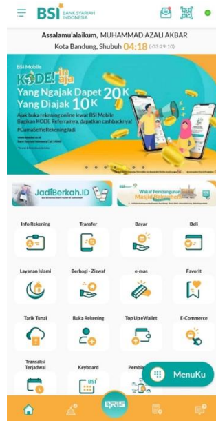
Gambar 1.3 Tampilan BSI Mobile

Aplikasi BSI Mobile dapat langsung diunduh pada Play Store untuk Android dan Apps Store untuk para pengguna gadget dengan sistem operasi iOS. Aplikasi BSI Mobile diharapkan dapat memudahkan para nasabah Bank Syariah Indonesia dalam menikmati layanan perbankan di mana saja.