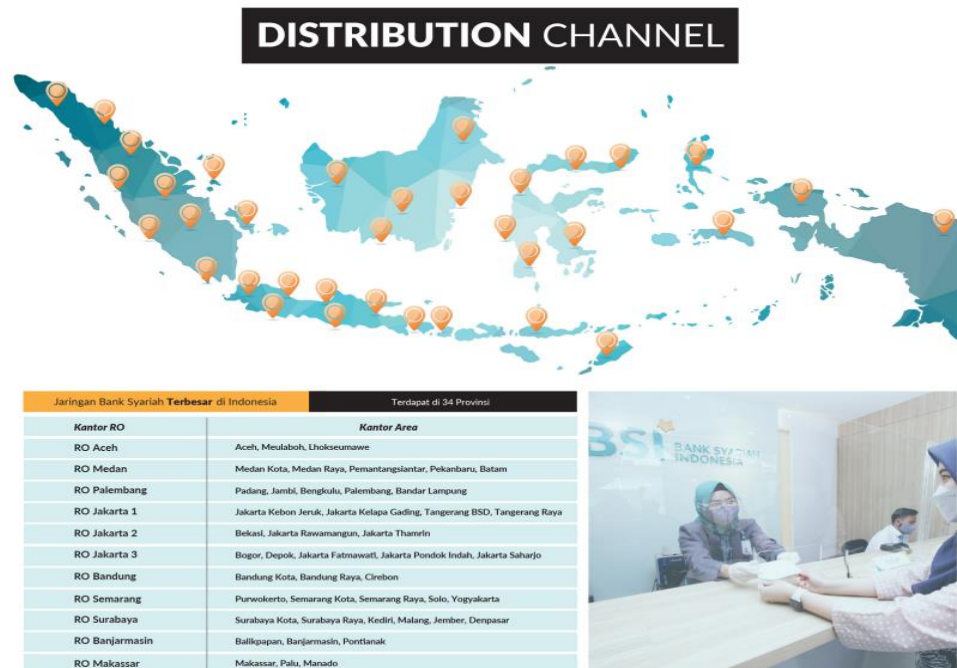
Gambar 1.4 Distribution Channel Bank Syariah Indonesia

Digital Brand Awards 2022. Berdasarkan laporan tahunan Bank Syariah Indonesia tahun 2021, sebaran cabang BSI sudah mencakup seluruh Indonesia dengan digolongkan sebagai kantor Regional Office (RO) .