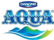
Gambar 1.1 Logo Aqua

Berikut ini adalah Logo yang dimiliki oleh: