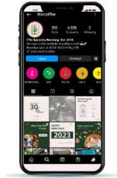
Gambar 4 Desain Instagram Tri Tangtu Kopi Roasters