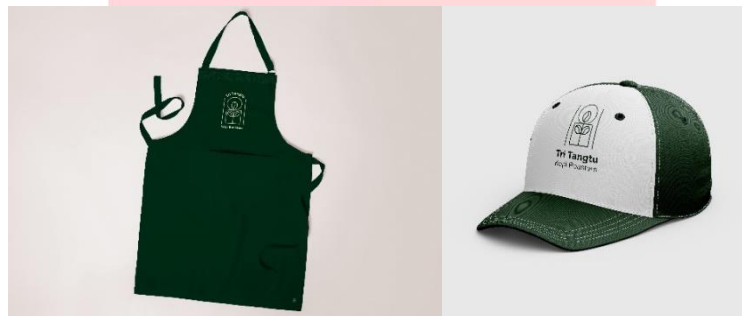
Gambar 8 Uniform Tri Tangtu Kopi Roasters