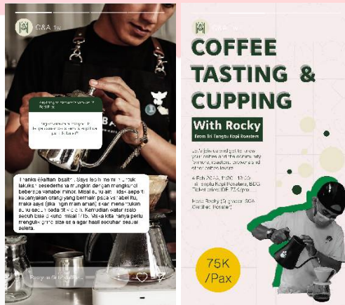
Gambar 5 Desain Instagram Story Tri Tangtu Kopi Roasters