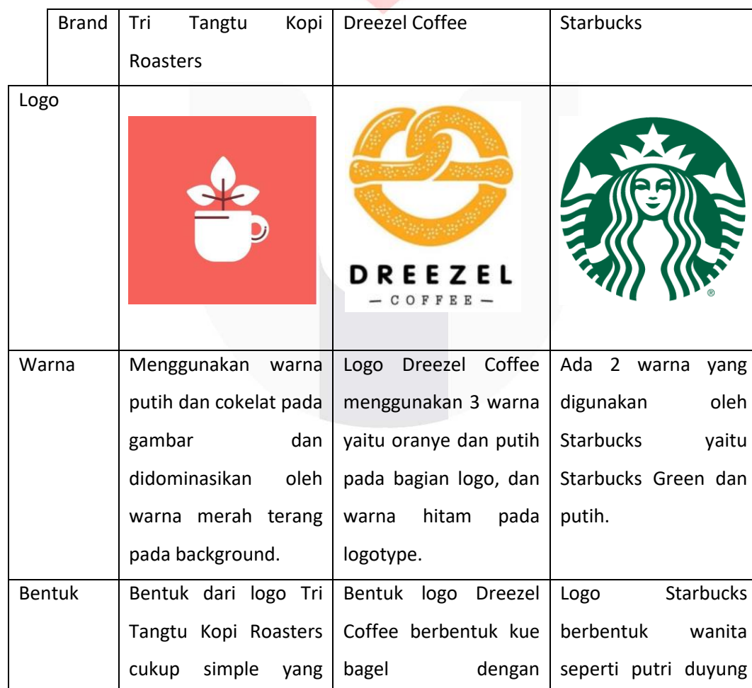
Table 1 Analisis Matriks Perbandingan