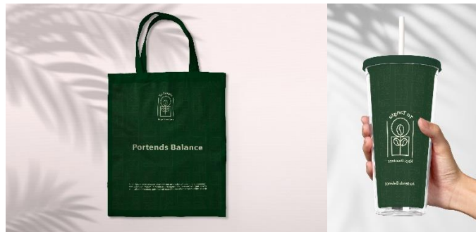
Gambar 7 Desain merchandise Tri Tangtu Kopi Roasters