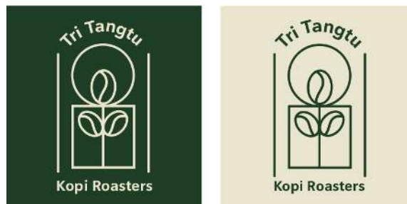
Gambar 2 Logo yang dipilih untuk Tri Tangtu Kopi Roasters

Logo baru yang dipilih menggunakan logogram dan juga logotype, dengan menggunakan font Vernacular Sans dan Sublima yang berjenis sans serif. Logo tersebut terdiri dari bentuk boboko dan ilustrasi biji kopi. Warna yang dipilih adalah hijau dan kuning, warna hijau dipilih karena menggambarkan alam dan bumi yang menimbulkan pertumbuhan dan warna kuning dipilih karena menggambarkan rasa ceria dan bahagia membuat kopi.