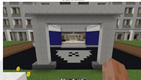
Gambar 2. Environment Warna Bangunan Fakultas Industri Kreatif