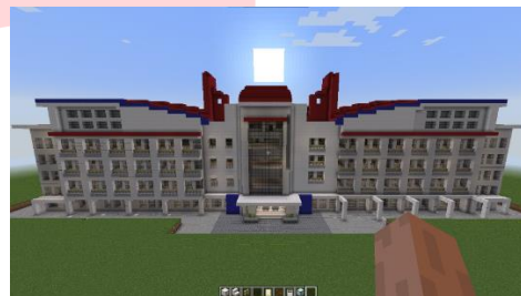
Gambar 1. Environment Bangunan Fakultas Industri Kreatif

Gedung Fakultas Industri Kreatif terdiri dari 5 lantai, yang mana pengguna dapat menjelajahi Fakultas Industri Kreatif. Gedung Fakultas Industri Kreatif dibuat semirip mungkin dengan yang aslinya, namun dibuat dari blok-blok Minecraft yang di- convert menggunakan Mcedit. Hasil pembuatan gedung Fakultas Industri Kreatif dapat dilihat dari gambar berikut ini: