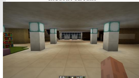
Gambar 3. Environment Tiang Bangunan Fakultas Industri Kreatif