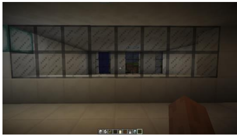
Gambar 4. Environment Kaca Bangunan Fakultas Industri Kreatif