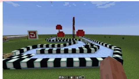
Gambar 10. Mini Games Mendayung