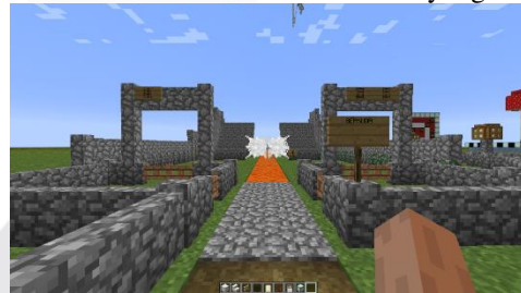
Gambar 11. Mini Games Berkuda