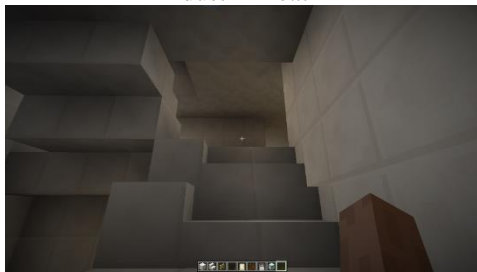
Gambar 5. Environment Tangga Fakultas Industri Kreatif