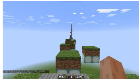
Gambar 8. Mini Games Parkour