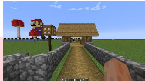
Gambar 9. Mini Games Memanah