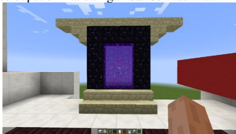
Gambar 6. Portal Menuju Mini Games

Setelah pengguna berkeliling gedung Fakultas Industri Kreatif, terdapat portal pada balkon Fakultas Industri Kreatif menuju portal untuk masuk ke dalam mini games . Mini games pada virtual ini meliputi parkour , mendayung, berkuda, dan memanah. Adanya fitur mini games ini adalah untuk memberikan pengalaman lebih selain melihat fasilitas dari gedung Fakultas Industri Kreatif. Hasil dari pembuatan mini games dapat dilihat dari gambar berikut ini: