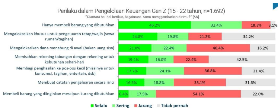
Gambar 1.4 Data Pengelolaan Keuangan

Tingkat literasi keuangan pada masyarakat Indonesia 2022 sebesar 49,68% menurut Surveo Nasional Literasi dan Inklusi Keuangan (SNLIK) 2022 dari Otoritas Jasa Keuangan (OJK), indeks ini masih terbilang cukup rendah. Tetapi pada survei tahun 2022 ini mengalami kenaikan dari tahun 2019 dimana literasi keuangan masyarakat Indonesia mengalami perbaikan. Perilaku pengelolaan keuangan generasi Z terbilang masih rendah pula yang memiliki kesadaran terhadap literasi keuangannya. Hal ini dapat dilihat pada data yang telah dilakukan oleh Katadata Insight Center, sebagai berikut: