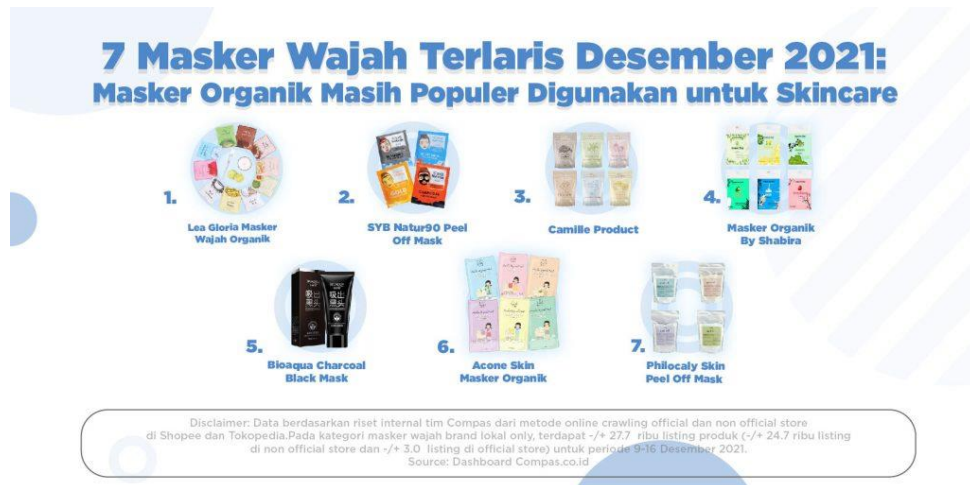
Gambar 1.3 Data Masker Organik Terlaris

Brand-brand yang telah mendapatkan label “ organic ” pada produknya, untuk brand lokal seperti The Bath Box, Klens & Kind, Sensatia Botanicals, Skin Dewi, Mineral Botanica, Organic Supply co., Pavettia Skincare, Vimala, Gulaco, Haple, True to Skin, Envygreen, dan Hale. Brand-brand ini yang dapat ditemukan secara mudah pada offline store yang menyediakan khusus produk kecantikan, online shop, dan e-commerce. Untuk produknya yang banyak digemari oleh kalangan generasi Z menurut data riset Kompas pada bulan Desember 2021 masker wajah berbahan organik masih banyak digemari dapat dilihat pada gambar di bawah ini.