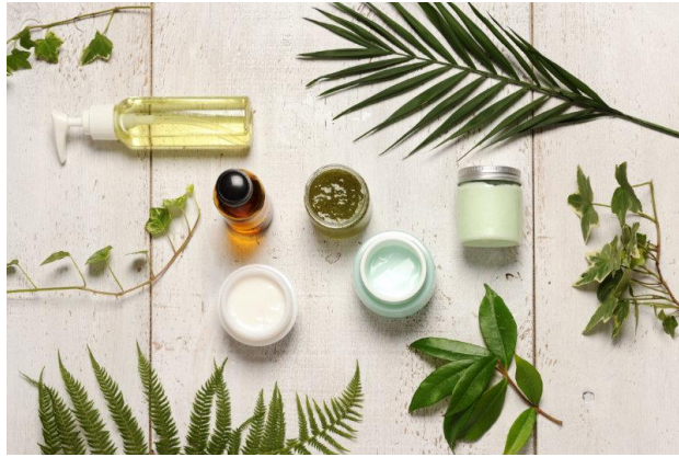
Gambar 1.1 Ilustrasi Skincare Organic