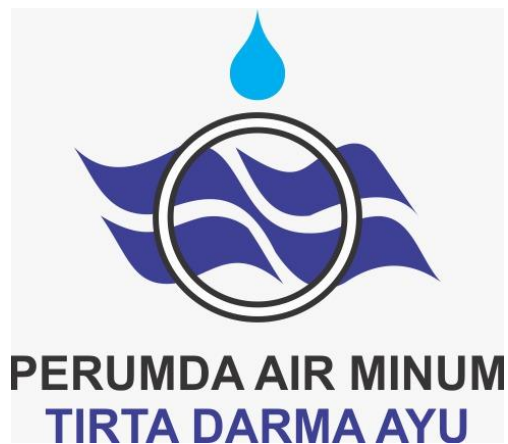
Gambar 1. 1 Logo Perusahaan

Berikut ini logo dari Perumda Air Minum (PDAM) Tirta Darma Ayu Kabupaten Indramayu: