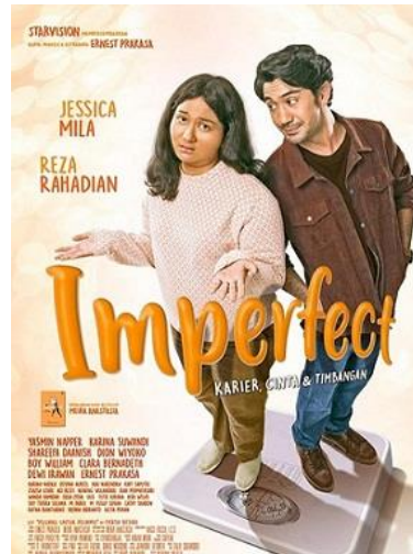
Gambar 1.2 Poster Film Imperfect: Karir, Cinta dan Timbangan